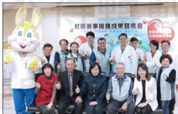
↑1月11日，高雄市藥師公會及高雄市第一藥師公會合辦「高雄市106年度社區藥事照護成果發表會」。

1月11日，高雄市衛生局、高雄市藥師公會及高雄市第一藥師公會合辦高雄市106年度社區藥事照護成果發表會，針對2種以上慢性病及持2張連續處方箋者、5種以上醫師處方用藥與醫院轉介個案進行藥事照護服務，自3月1日~10月30日，共完成10名醫院轉介個案、機構式照護76人次、社區式藥事照護212人，共有23家社區藥局參與，並成功發展藥事照護地圖，於二個公會網頁及衛生局網頁同步公告，以利提供市民更方便利用在地藥師服務。