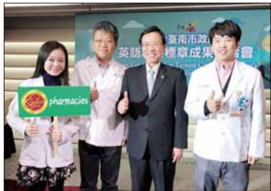
↑台南市代理市長李孟諤(右二)與具備英語溝通能力之社區藥局藥師合影。