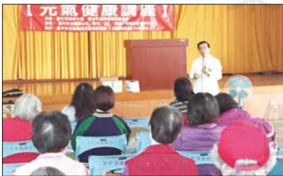
↑台中市藥師公會與台中市健保特約藥局協會辦理「養生調理藥膳」用藥宣導活動。