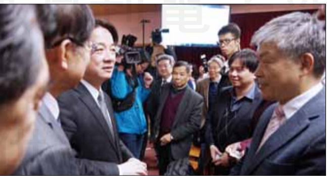
↑ 健保署於1月17日舉辦「醫療資訊上傳雲端與調閱分享無遠弗屆，分級醫療新紀元」記者會，藥師公會全聯會理事長古博仁應邀出席，並向行政院長賴清德說明讓藥師等醫事人員有更多發揮專業的空間。

【本刊訊】中央健康保險署於1月17日舉辦「醫療資訊上傳雲端與調閱分享無遠弗屆，分級醫療新紀元」記者會，除邀請行政院長賴清德、衛福部長陳時中共同主持記者會，並邀請醫師、藥師公會等醫事團體、消基會等代表，共同見證健保邁入影像調閱傳輸的新時代。