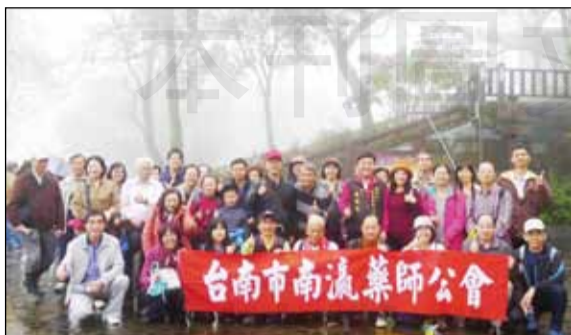
↑台南市南瀛藥師公會慶祝107年藥師節，1月6日舉辦「藥師節聯歡會及紅葉公園健走活動」。