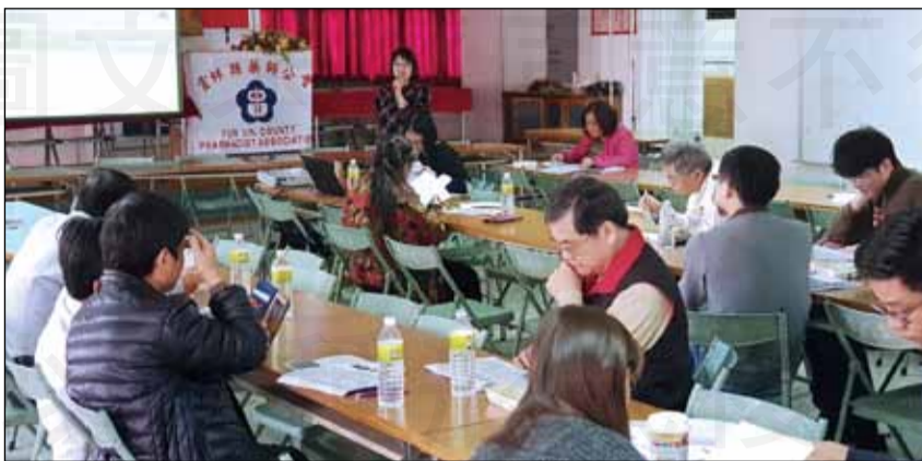
↑ 1月16日雲林縣衛生局舉辦藥事照護導入2.0整合性計畫說明會。

雲林縣自99年度起針對獨居老人用藥安全課題，積極推動相關政策，亦包括105年度「精進藥事照護模式與研究計畫」及106年度「建立社區整合性藥事服務網絡