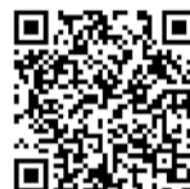
↑ 2018 GOLD 指引

也發展「一分鐘登階肺阻塞風險評估量表」，分別於全台北、中、南三處打造肺阻塞風險評估衛教山，融合診間六分鐘步行檢測(6MWD)與爬樓梯測試(SCT)於登山步道階梯，落實生活風險評估，讓民眾能邊爬山邊進行自我健康的監測。更多訊息請連結右方QR Code。