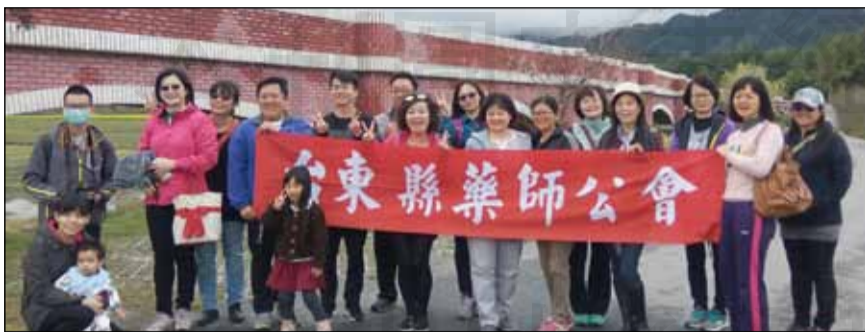
↑台東縣藥師公會舉辦自強活動，在鹿野二層坪水橋合影。

◎文／台東縣記者潘孟庭 讓藥師會員們增加家庭親子間的感情，特地挑選今年的第一個週末，剛好也是藥師節前夕，舉辦自