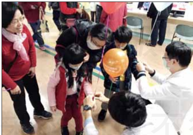
↑ 歡慶藥師節，國軍桃園總醫院藥師用氣球與小朋友互動。

除了舉辦衛教講座，當然也讓民眾看到藥師活潑親民的一面，為了達到最大的宣傳效果，訂製了專屬藥師的宣傳氣球，在上面印製「藥師是您最好的鄰居/藥師節快樂」等標語，發送往來的小朋友和大朋友們，宣傳效果十足。在「我問你答拿獎品」的有獎徵答活動，以簡單的問題例