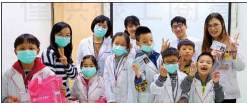
↑ 1月26日，台中光田綜合醫院藥劑部藥師邀請北勢國小學生，參加「奇幻醫院之旅——藥師魔法學園」活動。

為使國人從小對自我醫療照護產生興趣，並且培養正確的觀念，甚或立志成為醫療人員，各家醫療院所或社區藥局皆非常樂意與鄰近的學校互動，讓學生們透過參訪醫療院所或藥局來瞭解醫療人員的工作。1月26日台中光田綜合醫院邀請沙鹿地區以少棒聞名的北勢國小學生，參加藥劑部藥師們精心設計的「奇幻醫院之旅——藥師魔法學園」活動，透過親自參觀醫院藥局，並以生動的方式向學生們解說藥師調劑、核