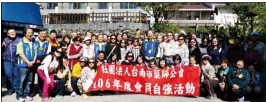
↑台南市藥師公會106年會員自強活動，至南投旅遊。

◎文／台南記者林亨達 台南市藥師公會106年歲末最後一次的會員自強旅遊活動，選擇了素有好山好水美名的南投縣。首先來到「向山行政暨遊客中心」，鳥瞰建築物，猶如雙手環抱整個日月潭的湖光山色，日月潭的湖光山色穿過寬闊的跨距空間，直接映入眼簾，創造了人類與大自然間對話的舞台，不但是棟宏偉建物，亦是一件藝術品也不為過。