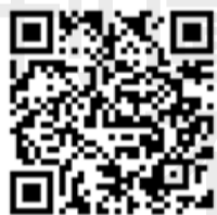
←管制藥品濫用通報資訊系統連結網站。

近年來，藥師投入藥物濫用宣導與通報成效卓越，當醫院及診所藥師發現個案被判定為非經醫囑，不當或過度使用成癮物質而至醫療機構就診、戒毒者均屬之，藥師即可藉由管制藥品濫用通報資訊系統，進行線上通報。而自民國101年起，行政院衛生署便積極推動社區藥師藥物濫用防制師資培訓，因此政府更應鼓勵將社區藥局藥師納入進行通報的行列，運用藥師專業全方面防制濫用藥物危害國人健康，更是身為藥師肩負全民用藥守護者的使命。