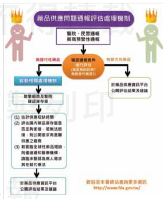
↑藥品短缺通報評估處理機制。