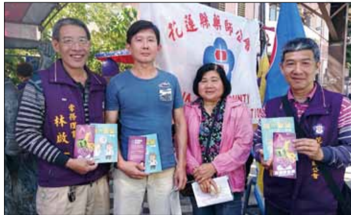
←花蓮縣藥師公會於3月4日舉辦捐血活動，共募得121袋血液。