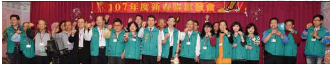
↑高雄市第一藥師公會於2月24日舉辦107年度新春聯歡晚會。