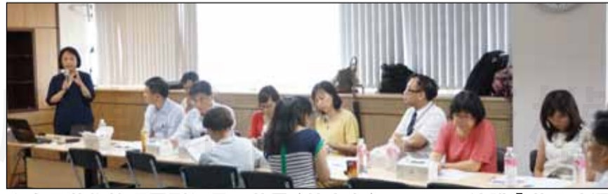
↑食品藥物管理署副組長祁若鳳(站立者)8月15日演講「藥品流通管理及藥政管理現況」。

理，包括原料藥管理(原料藥品質及來源登錄)、製劑管理(上市前審查及上市後變更管理)、製造管理(GMP管理與稽查)、運銷管理(GDP管理與稽查)、上市後監測(政府主動監測及外界通報)等。