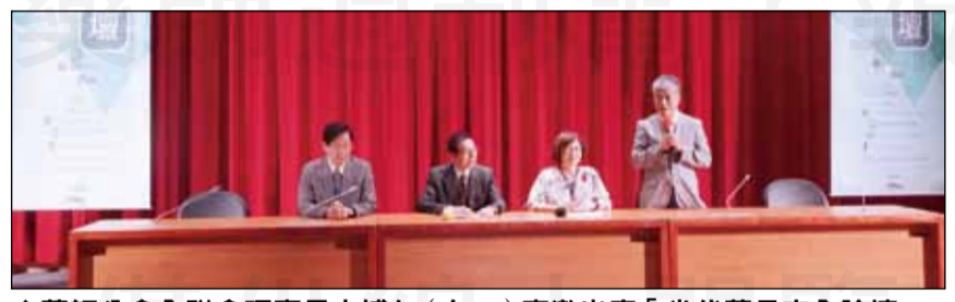
↑藥師公會全聯會理事長古博仁(右一)應邀出席「當代藥品安全論壇」。

【本刊訊】消費者文教基金會於8月24日舉辦當代藥品安全論壇，討論議題包括：藥食同源、癌症用藥、台灣製藥品質與全民健康、中藥材管理等。藥師公會全聯會理事長古博仁應邀出席，他感謝消基會長時間站在民眾端，站在第一線幫助民眾，用檢驗數字來檢視食安、藥安，讓民眾吃得健康。 古博仁表示，用藥的問題，需面對問題、檢視問題，幫助民眾做正確的教育，如何吃得健康、讓藥品副作用減少、療效增