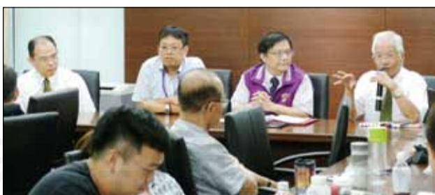
↑新北市藥師公會結合中華景康藥學基金會，共同舉辦社區藥局實習指導培訓研習會。

8月12日課程採傳統教學模式，課程內容包括：教導如何成為適任的社區藥局實習指導藥師、指導藥師必備的特質與訓練、執業藥師的人文素養