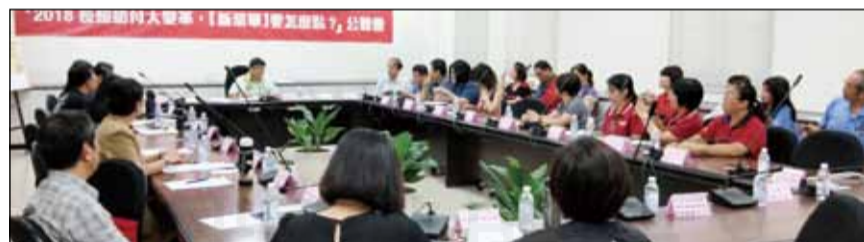
↑8月6日，高雄市藥師公會應邀參與與高雄市議會舉辦的「2018長照給付大變革，『新菜單』要怎麼點？」公聽會。

高雄市高齡化人口成長迅速，統計至107年1月底，大高雄老人人口數為39萬7,090位，占全市人口總數14.3%。長照服務無論執行金額與執行率，高雄市均名列前茅，106年度長照執行率為六都第二。許多民眾不知如何申請使用長照服務，而提供服務的專業人員及照顧服務員，對長照輸送制度及資源整合亦心存疑問。高雄市議員鄭光峰於8月6日，在高雄市議會舉辦「2018長照給付大變革，『新菜單』要怎麼點？」公聽會，高雄市藥師公會應邀與會，並提供醫事專業人員面臨長照的問題與困難。