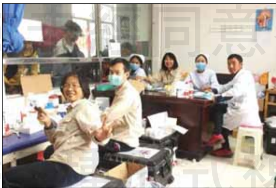
↑參與路竹會大陸青海義診團隊，藥師專業付出，留下幸福回憶。

園的雲翔及高雄服務的我。在上飛機前互相自我介紹打了招呼後，開始了青海高原上的藥事服務。兩位藥師負責調劑、一位double check負責解說用藥方法、須知及藥物作用。因為語言的隔閡，需透過翻譯解釋，資源有限很難做到用藥安全，也不知平常是否有其他疾病，資訊來源是來自醫師手寫的病歷。來義診的人很多，調劑檯前的玻璃總是擠滿了人。在接到處方的瞬間要馬上判斷疾病及用藥的相符性、用