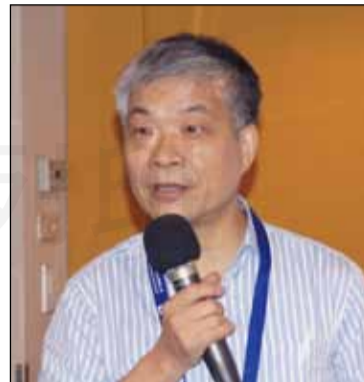
↑「107年度藥師週刊全國記者座談會」於9月9日召開，特別邀請藥師公會全聯會理事長古博仁（右圖），專題演講「全聯會政策和方向」。