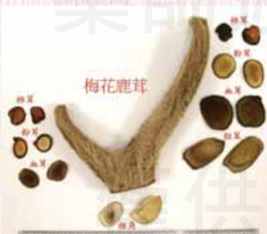
↑圖一 台灣中藥市場鹿茸藥材之相對部位