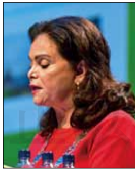
↑ FIP 主席 Carmen Pena。

衛生組織的一份追蹤全球全民健康保險監測報告中提到，有一半人口繼續被剝奪基本健康服務，要獲取藥物仍然是一個遙遠目標，特別是婦女和兒童。