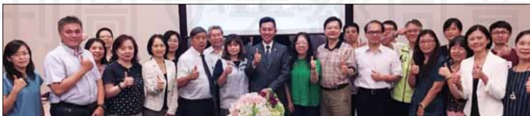
←新竹市藥師公會於8月26日，舉辦第12屆第10次理監事聯席會，市長林智堅蒞臨與藥師互動交流。

林智堅對於新竹市民的用藥安全努力，表達肯定與感謝。接著在市政簡報中說明，新竹市雖然面積不大，只有104平方公里，卻有著「三高一低」獨特的城市DNA，「三高」就是指「所得高」、「出生率高」及「教育水準