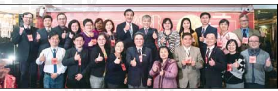
↑台灣醫療品質促進聯盟於1月21日舉辦「2018醫事團體聯合感恩餐會」，理事長古博仁（左圖左一）表示，藥師樂意與各醫事團體站在一起，照護全民健康。各醫事團體幹部與立法院長蘇嘉全（右圖後排右七）合影。

【本刊訊】台灣醫療品質促進聯盟於1月21日舉辦「2018醫事團體聯合感恩餐會」，感謝及回顧2018年各醫事團體發揮專業，照護民眾健康所付出的努力。