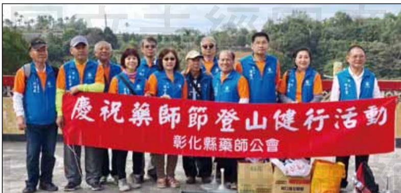
↑彰化縣藥師公會慶祝藥師節，特別舉辦親子眷屬登山健行活動。

過完元旦假期，緊接而來的是專屬我們藥師自己的日子「藥師節」。彰化縣藥師公會為了鼓舞大家的士氣，並提醒藥師要走進人群，特別在藥師節前的假日舉辦親子眷屬登山健行活動。路程的設計為了因應不同年齡層的會員，選定在員林百果山藤山步道誓師，在山頂的鳳天宮舉行早餐會及摸彩活動。