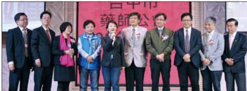
↑台中市藥師公會於1月6日舉辦慶祝藥師節晚會，台中市長盧秀燕(左五)表揚「藥事服務獎」績優藥事人員。

台中市藥師公會於1月6日，在潮港城帝國宴會廳舉辦慶祝藥師節晚會，由主持人李淑玲理事長為晚會揭開序幕。會中，台中市長盧秀燕逐一表揚獲得市府「藥事服務獎」的16位績優藥事人員；藥師公會全聯會理事長古博仁也表揚藥師週刊記者服務獎。與會貴賓包括衛生局長曾梓展、社會局長李允傑，立法委員黃國書、張廖萬堅，市議員江肇國、黃守達…等，席開140桌，逾千名會員參加，熱鬧非凡。