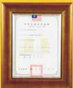
新型專利 (第 M 445736 號)