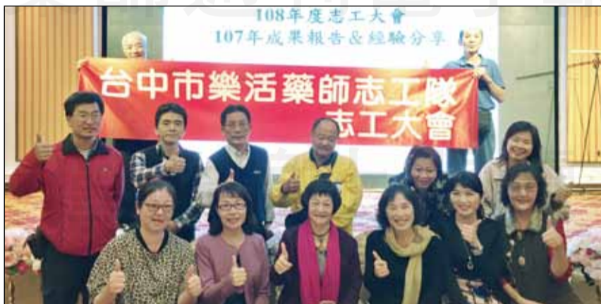
↑台中市藥師公會「樂活藥師志工隊」於2月17日舉辦第一次志工大會，進行成果報告和經驗分享。

「樂活藥師志工隊」隸屬主管機關審核通過之社福類志願服務團隊，自成立以來，共招募35位藥師志工，31位已取得志願服務紀錄冊，轄下設有：行政、活動、關懷三個組別。回顧107年，在公會部分有安排志工服務與教學，其項目包括：一、繼續教育