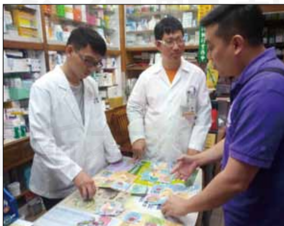
↑社區藥局藥師利用桌遊「東·斯孟克(Don't smoke)」，宣導吸菸的危害。

根據世界衛生組織(WHO)資料顯示，世界上平均不到5秒就有一人因菸害失去生命，我國雖已訂定《菸害防制法》，然而近年來吸菸人口下降幅度卻相當有限。身為健康相關從業人員(health care professionals)，菸害對我們來說是耳熟能詳的，但對於社會大眾而言，他們不一定瞭解吸菸的壞處。相較於傳統以簡報講演的衛教宣導，或許桌遊是更能吸引眼球的好方法。遊戲過程中，民眾藉由卡牌上的資訊來增進相關的健康識能(health literacy)；此外，