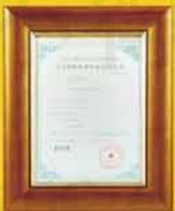
軟體著作權 (登字第07-49699 號)