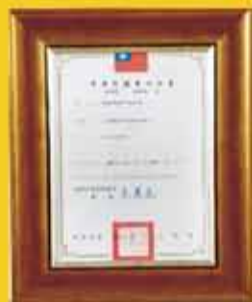
發明專利 (第 I 508020 號)