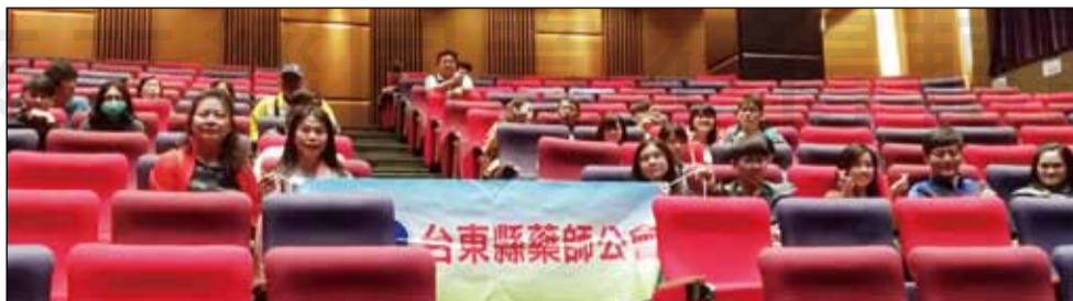
←台東縣藥師公會暨台東縣藥劑生公會邀請會員觀賞台東在地電影「寒單」。

農曆新年是全世界華人與家人團圓歡樂時光，而在台東的新年更是從除夕直到元宵都年味十足，尤其是元宵時的「炸寒單」文化，更是與北天燈、南蜂炮齊名的元宵台灣特色文化。而今年，由台東子弟黃朝亮導演將寒單文化搬上大螢幕，以電影形式來行銷推廣台東同時保存在地珍貴的文化。在這一觀點想法與