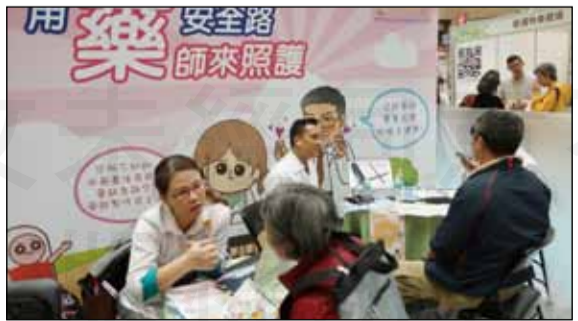
↑「用藥諮詢」攤位，由專業藥師為民眾解答用藥問題。