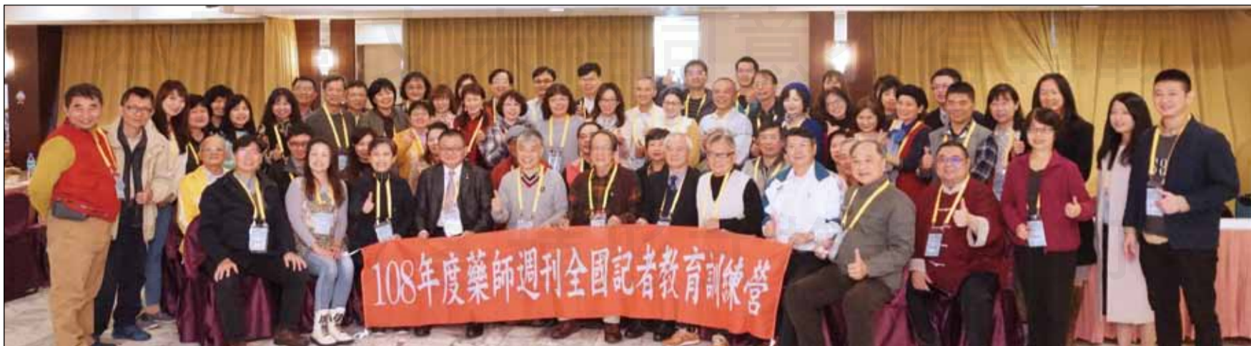
↑藥師週刊全國記者教育訓練營，於3月9日移師宜蘭舉辦。