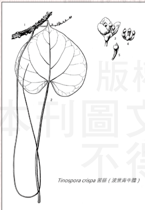
↑ 中國植物志之波葉青牛膽 Tinospora crispa (L.) Hook.f. & Thoms. 植物。