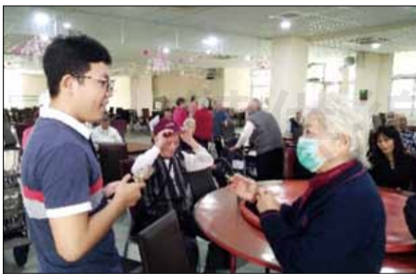
↑藥學生社區藥局實習，安排到養護中心實地了解藥師執行藥物治療評估。

由於社區藥局的中心仍是為社區民眾提供服務，在熟悉藥局備有的處方藥、非處方藥和保健食品及醫材後，於藥師的督導下，參與藥品調劑、民眾衛教和依民眾需求推薦保健食品或醫材。有時，關心民眾並多聊幾句，可能就會發現他們在用藥上的問題。