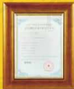
軟體著作權 (證字第07 49699 號)