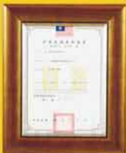
新型專利 (第 M 445736 號)