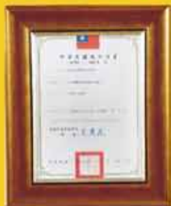
發明專利 (第 I 508020 號)