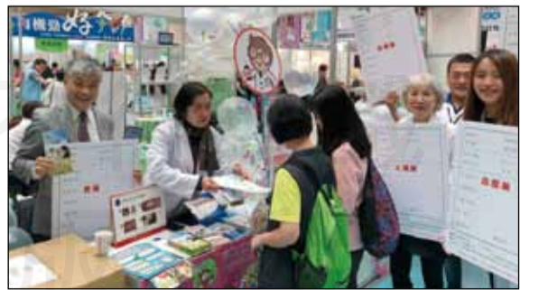
↑「藥事照護」攤位，為民眾說明，戒菸、廢棄藥品如何處理等。