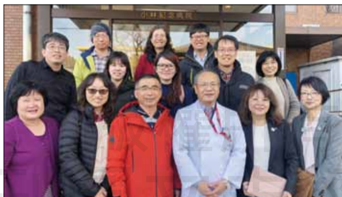
←藥師參訪小林紀念病院，取經日本褥瘡照護。圖前排右四為褥瘡照護達人古田勝經。

古田勝經1976年名城大學藥學部畢業，經國立名古屋病院、國立長壽醫療研究センター藥劑部副部長與臨床研究推進部高齡者藥物治療研究室長等歷練，現為醫療法人愛生館小林紀念病院褥瘡ケアセンターセンター長（褥瘡照護中心主任）。古田勝經曾參與超過千例的褥瘡照護案例，長期鑽研後以藥師的觀點提出了「FURUTA Methods」，不但發表諸多學術論文、專著，亦參與日本褥瘡指引（褥瘡予防・管理ガイドライン）的編寫。與傳統褥瘡照護概念不同，FURUTA Methods並不特意強調營養補給，其理論的