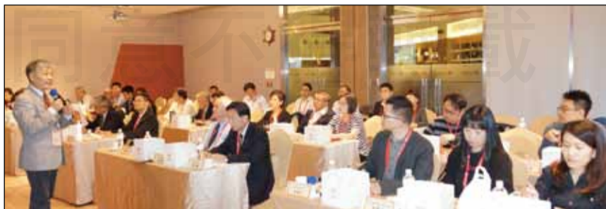
↑藥師公會全國聯合會於3月30、31日在新竹舉辦「全國各縣市藥師公會媒體應變研習營」。