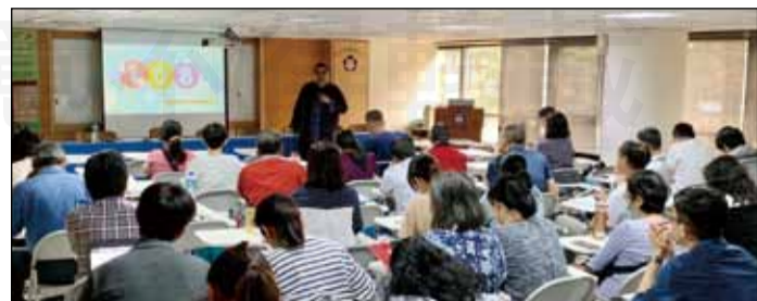
↑「社區民眾正確用藥環境計畫」於3月21日召開中區種子師資培訓課程。