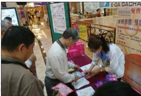
↑義大大昌醫院於情人節前夕舉辦「『房事』美滿全攻略，健康『性』福有保障」衛教活動。

流程的諮詢，讓有效的治療找回身心靈的健康快樂。根據衛福部統計，子宮頸癌在國內女性