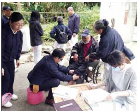
↑藥師配合中區人醫會，前往苗栗偏鄉南庄進行義診。