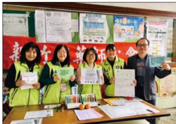
↑新竹市藥師公會受邀至新竹高中愛心園遊會設攤宣導用藥安全。