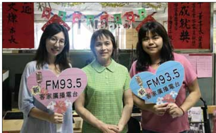
←桃園市藥師受邀至新客家廣播電台(FM 93.5)接受採訪，說明桃園市居家藥事照護服務內容。

居家藥事服務是桃園市友善藥事整合計畫中相當重要的工作項目，亦是近年來藥師主力推動