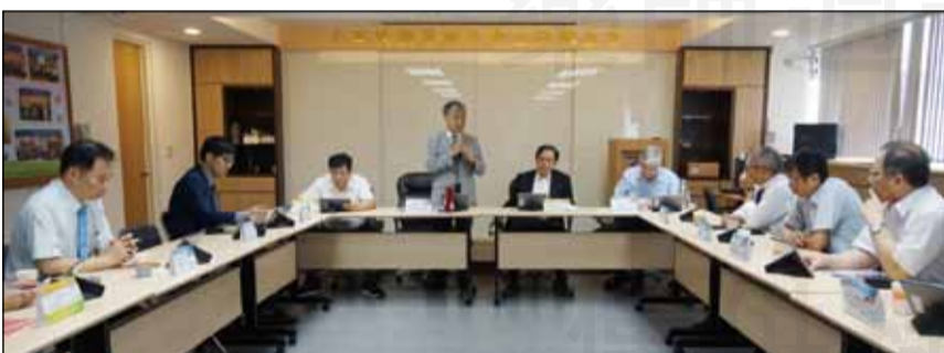
↑藥師公會全聯會於7月5日邀集專家學者召開「藥事法施行細則第五十條」修法會議，促使醫藥分業政策能更具明確性。