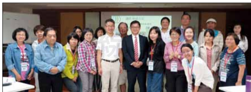
↑台北市藥師公會舉辦「正念減壓與轉念力量於藥事服務的妙用」課程，希望會員藉由「正念」與「轉念」的思考提升生活及工作品質。

此課程的發源，是1979年美國麻省理工學院分子生物學博士、麻塞諸賽州醫學院的榮譽醫學博士，也是禪修指導師、作家喬·卡巴金(Jon Kabat-Zinn)甚而在麻州大學醫學院開設減壓診所，並設計了「正念減壓」課程(Mindfulness-Based Stress Reduction, MBSR)，協助病人以正念禪修處理壓力、疼痛和疾病，並訓練師資，以廣為幫助大眾。發展至今，目前全美國有兩百多