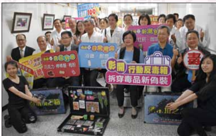
↑彰化縣於7月2日舉辦「彰開行動反毒箱、拆穿毒品新偽裝」記者會，以行動擺攤方式推出「反毒宣導箱」。

詮釋新興毒品型態種類花樣百出，反毒宣導箱裡融入毒咖啡包、毒梅粉等擬真教材、數位互