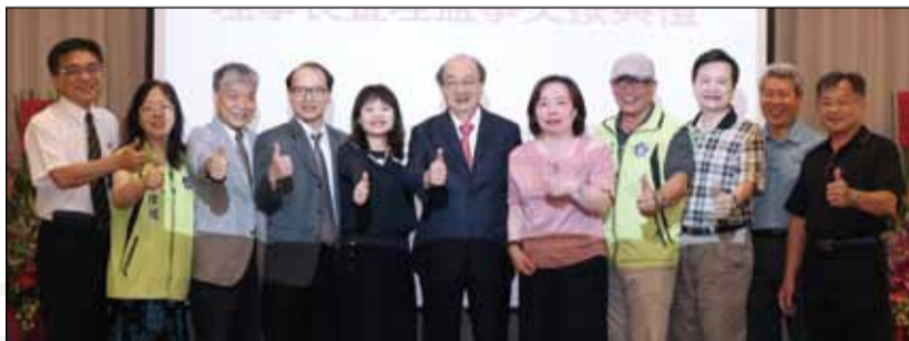
↑新竹市藥師公會於6月30日舉辦新舊任理事長交接典禮，貴賓雲集。

全體藥師和各醫院團體的支持，使任內推動正確用藥宣導活動、高診次藥事照護、繼續教育課程等，成果相當亮眼。