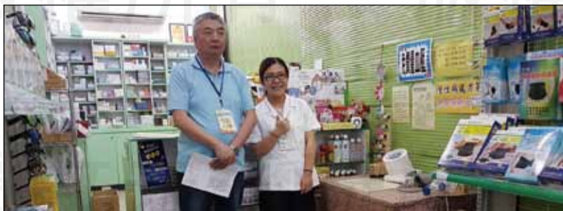
↑嘉義市「108年度建構高齡友善藥局計畫案」鼓勵社區藥局參加「高齡友善藥局」評核認證。

高齡友善藥局評核，自主報名參加的藥局相當的踴躍，評核委員自7月1日起至17日止，將分組實地評核。參與評核的藥局必需具有健保藥局資格，也需要