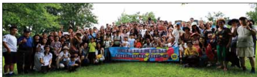
↑雲林縣藥師公會於7月7日舉辦自強活動，前往苗栗客家庄。

首先映入眼簾的是筆直高大的杉木林和湖畔，這是傳說中賽夏族矮靈祭的「向天湖」，具有濃濃的原住民文化特色。步道旁不知名花草依棲在層巒疊翠的湖光山色中，在藍天白雲的搭配下，