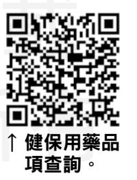
↑ 健保用藥品項查詢。

• 有關健保用藥品項，相關異動藥價資訊說明，全國藥師可至健保署網站查詢。健保署網站 http://t.cn/AiWyCUE2