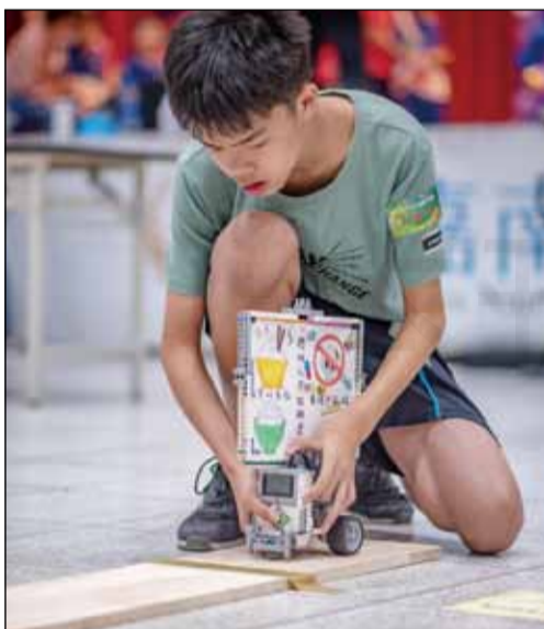
↑台南市南瀛藥師公會與嘉南藥理大學及台南市政府衛生局辦理「2019 嘉藥 AI 反毒機器人競賽」。