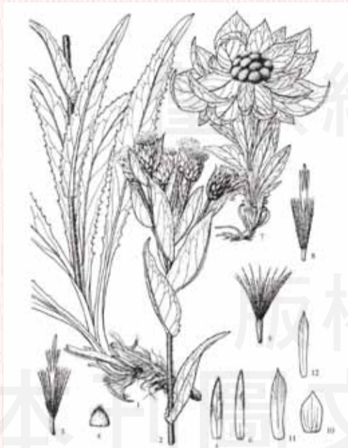
(來源 Flora of China, Saussurea involucrate 雪蓮花圖)

莖呈圓柱形，長2~48cm，直徑0.5~3cm；表面黃綠色或黃棕色，少數微帶紫色，具縱稜，斷面中空。莖生葉密集排列、無柄，或脫落留有殘跡，完整葉片呈卵狀長圓形或廣披針形，兩面被柔毛，邊緣有鋸齒和緣毛，主脈明顯。頭狀花序頂生，10~42個密集成圓球形，無梗。苞葉長卵形或卵形，無柄，中部凹陷呈舟狀，膜質，半透明。總苞片3~4層，披針形，等長，外層多呈紫褐色，內層棕黃色或黃白色。花管狀，紫紅色，柱頭2裂。瘦果圓柱形，具縱稜，羽狀冠毛2層。體輕，質脆。氣微香，味微苦。