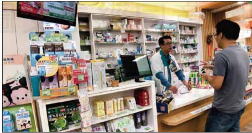
↑「樂森藥局」為目前大台南地區唯一的愛滋友善藥局。

賺錢，只是很單純的想要服務這些病患。加入之後才知愛滋病的用藥幾乎沒有藥價差的空間，而且每位病患的藥費約在15000元-20000元之間，要是遇到醫師處方開28粒，而一盒藥是30粒，就可能需承擔剩藥2顆的成本積壓風險。