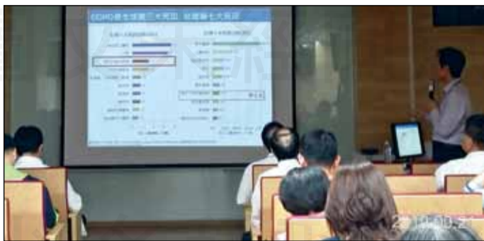
↑台灣臨床藥學會在9月21日於苗栗醫院舉辦中區雙月會。

課程上半場是由醫師說明肺阻塞和SGLT2降血糖用藥新知。醫師提到肺阻塞民眾會出現咳嗽、胸悶、呼吸困難的症狀，要緩解這些症狀，降低疾病惡化率，可使用藥物來治療，依照CAT或mMRC評量表以及急性惡化風險的次數，可將病人分成A、B、C、D這4種類別，而長效抗膽鹼藥物(LAMA)是B、C、D組的首選藥物，包括tiotropium、umeclidinium，跟長效β作用劑(LABA)相比，LAMA預防急性惡化的效果較佳，而病人血液中的嗜酸性球若大於300/ \mu L，因惡化風險高，可額外使用