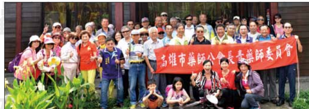
←高雄市藥師公會於9月29日在大坪頂熱帶植物園辦理健走活動。

大坪頂熱帶植物園位於高雄市西南方，居鳳山水庫旁並與臨海工業區相鄰，面積約17公頃，是除「恆春熱帶植物園」外，全國第一座以保育、研究、教育及遊憩建構的都會熱帶植物園，並於2010年榮獲「國家卓越建設獎」優良環境文化類—金質獎，有「綠明珠」之稱。園區計栽種植物500多種，6萬餘株，運用原