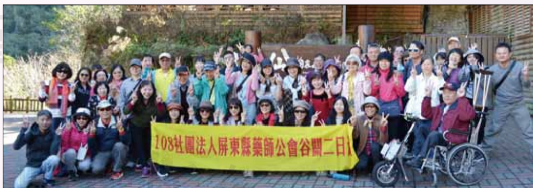
↑屏東縣藥師公會於12月14、15日舉辦自強活動，「沐戀谷關、成美鹿港、八仙山芬多精」二日遊。

行，倘伴林間享受芬多精的浸潤。回程來到泰安鐵道文化園區，感受舊火車站充滿讓人懷舊的氛圍。