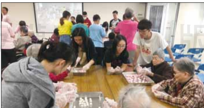
↑嘉南藥理大學師生至護理之家，陪伴關懷長者過冬至。

「冬至圓仔呷落加一歲」，長輩們在護理之家能得到完善、體貼的照護，搓湯圓期許他們健康並長壽，更有許多家庭攜著大小朋友，共同參與搓湯圓，現場充滿濃濃溫馨、熱鬧的氣氛。最深刻的是與長輩們噓寒問暖，雖然我們台語「不輪轉」，但緊握那布滿皺紋的雙手，感受是那樣的有溫度。