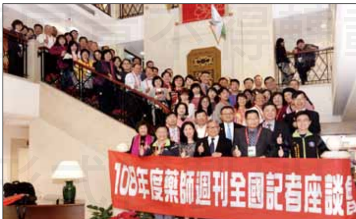
←108年度藥師週刊全國記者座談會於12月22日在台北華國大飯店舉行，藥師公會全聯會理事長黃金舜針對「全聯會政策及方向」，進行專題演講。