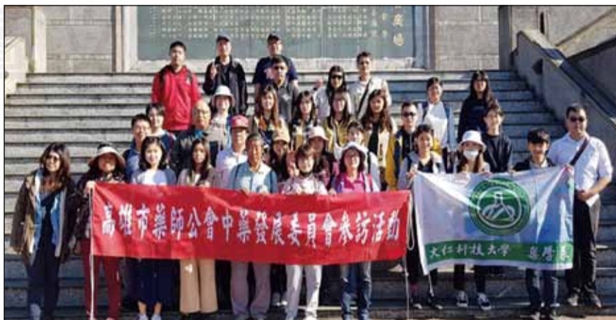
↑ 高雄市藥師公會中藥發展委員會暨大仁科技大學藥學系嘉義半天岩聯合藥用植物採集教學。

一行人還沒上山，老師立刻信手拈來，從紅磚縫中採了一株很熟悉的青草，馬上出題目考考學員們，原來是常常和台灣蒲公英混用誤認的小本蒲公英，俗稱兔兒菜，兩者皆屬菊科，但不同屬，台灣蒲公英較大，兩者葉形不同；菊科系列的草藥頗多，還有路邊常見的咸豐草，老師說民間常用於盲腸炎，能有不錯療