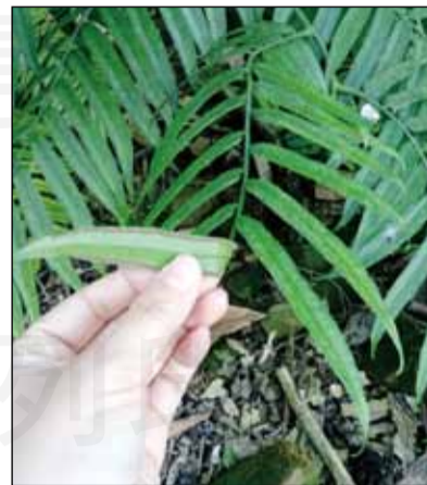
↑ 合囊蕨科觀音坐蓮，特徵：孢子囊群位在小羽片側脈接近葉緣處的兩側，羽狀複葉，沒有孢子的為營養葉，負責吸收養分。

效。原住民常用其根沾鹽食用，炒過後甜滋滋的很下飯。沿著山徑前進，遇見常在急診遇到的誤食事件植物之一「姑婆芋」，曾經轟動一時的官員誤食事件，大夥兒還記憶猶新，是不好惹的天南星科！可是在野外遭到咬人貓或咬人狗襲擊時，其所含的生物鹼卻能中和其酸，緩解腫痛，大自然天地之間的相生相剋之道，著實奧妙。