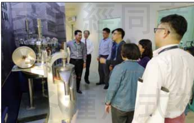
↑台南市社區藥局於12月18日，帶領實習生參訪益生菌的產業與研發生產製造。

覽解說外，並就益生菌運用於人類、畜牧業、水產養殖業的發展向所有師生進行報告說明，