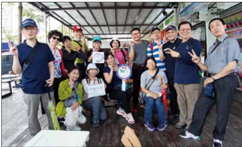
↑臺中市藥師公會於5月至9月期間，舉辦「藥愛健康 樂活集點」活動。

近來台灣疫情趨緩，政府防疫解禁，國人終於可以從5個月的防疫緊張期解放，然而國外疫情仍然緊張，大家只能在國內走走散心。政府規劃了安心旅遊國旅補助方案，臺中市藥師公會也提供了振「心」活動，只要是會員皆可參加。