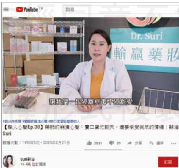
↑「一則影片可以吸引近12萬人的觀賞」，年輕藥師可以考慮這樣玩，來創造屬於藥師的未來。

老藥師的故事感動很多人，老藥師他們曾經為了爭取醫藥分業奮鬥了好多年，這些老藥師有一天會消失在這個舞臺，現在中生代的藥師會