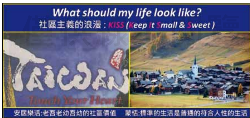
↑圖一 KISS-醫師藥師是庶民行業。

她提到大前研一論趨勢，引用2006年《美國再見》一書預言世界經濟風暴，指出「主流不一定是對的」。果然2009年爆發華爾街金融風暴，成就了E. Ostrom以「體系管理論預防錯誤」獲得諾貝爾