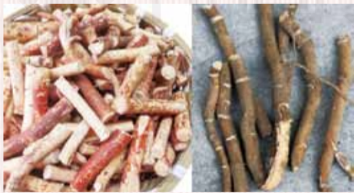
↑有毒的鉤吻根(右)有環狀裂紋，外貌與無毒的五指毛桃(左)有一些差別。

香港食安中心近年將五指毛桃與斷腸草列為容易混淆中藥。五指毛桃基原為桑科(Moraceae)植物粗葉榕 Ficus hirta Vahl. 的乾燥根。能益氣健脾，祛痰化濕，舒筋活絡，是頗受歡迎的香港煲湯材料。但由於五指毛桃常與斷腸草同地生長，而且根外形略似，故採挖五指毛桃時容易混入有毒的斷腸草。香港過往亦有因五指毛桃摻雜斷腸草而導致中毒的事件發生，故應注意區別，以免中毒。