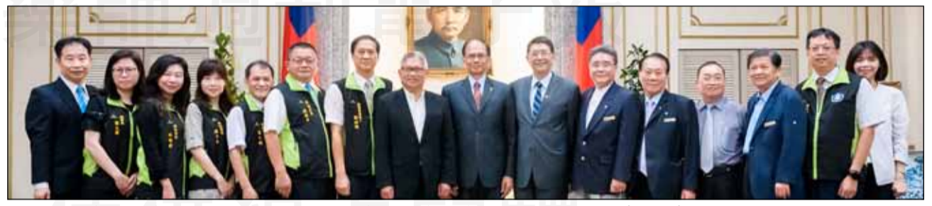
↑藥師公會全聯會於6月8日偕藥劑生公會全聯會拜會立法院長游錫堃(右八)，建請健保署依法落實指示藥不給付。