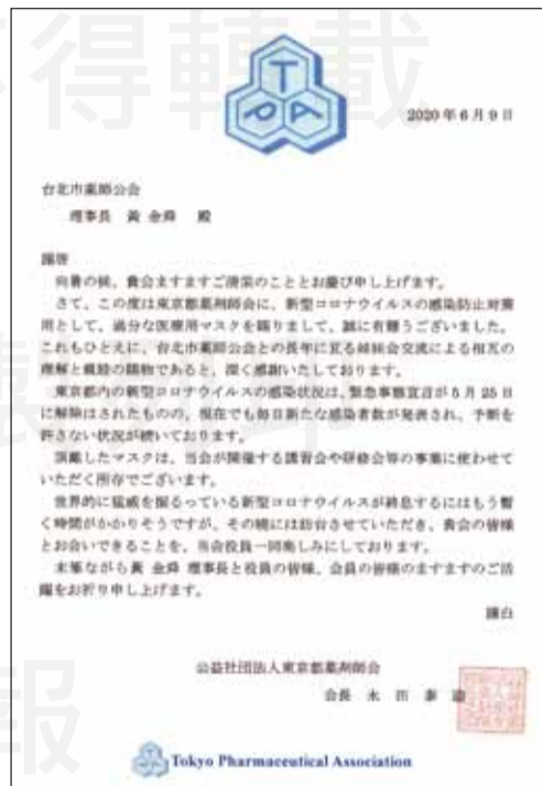
↑ 日本東京都藥劑師會於6月9日回覆感謝函。