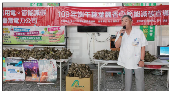
↑彰化縣衛生局、藥師公會於6月21日舉辦「社區用藥安全暨藥物濫用宣導」。

二、用藥安全五問步驟：1.問藥名-什麼藥？2.問藥效-做什麼？3.問用法-怎麼用？