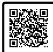
線上繼續教育系統 操作說明影片