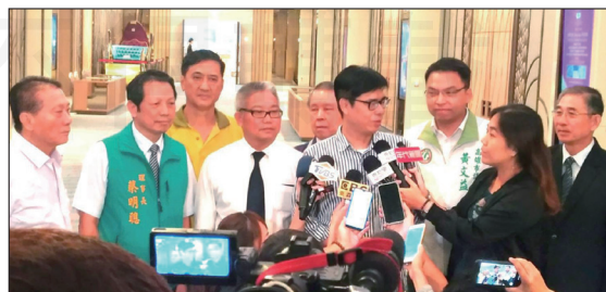
↑理事長黃金舜（左三）陪同前行政院副院長陳其邁（右三）受訪。

與謾罵。期間也感謝時任行政院副院長的陳其邁，透過他居中協調，口罩實名制才能走得這麼順利，這100多天，政府與民眾皆感受到藥師的重要性，在台灣防疫史上立下汗馬功績。