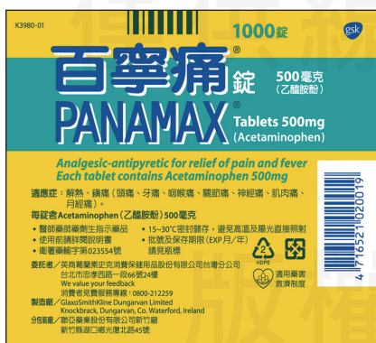
↑百寧痛外盒。

面對眾多疑慮，食藥署出面說明此次藥證註銷，一併取消健保給付者為百寧痛 Panamax，其許可證發證日期為2002年9月30日，並在2018年11月2日到期。