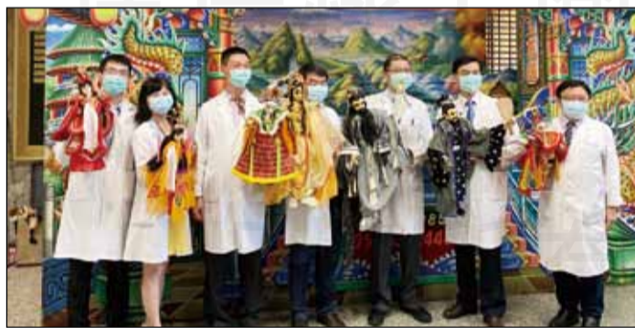
←高雄長庚於9月17日結合台灣在地文化布袋戲的變臉，展開為期一周的病安之旅。

今年病人安全週日期為9月14日至20日，宣導主軸是「為病安發聲」，高雄長庚於9月17日結