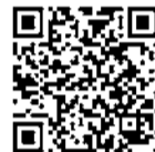
Curel益膚日 報名QR Code