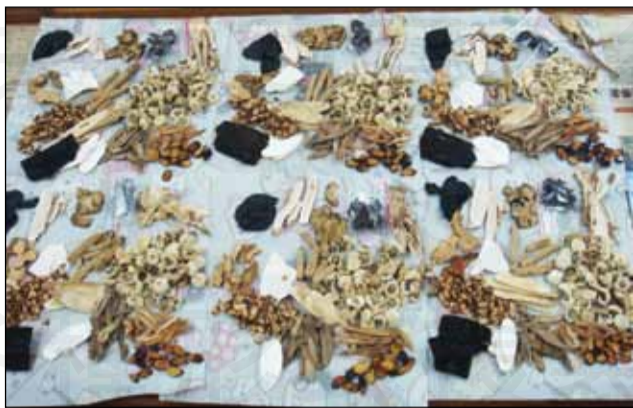
↑藥膳包是藥師切入中藥執業領域的簡易入門項目，秋冬來了，藥師投入中藥執業領域正是時候。

過去，中藥的執業普遍存在父傳子、親族教導親族，不對外指導的運作模式。即使是國考合格的藥師，若家族無人從事中