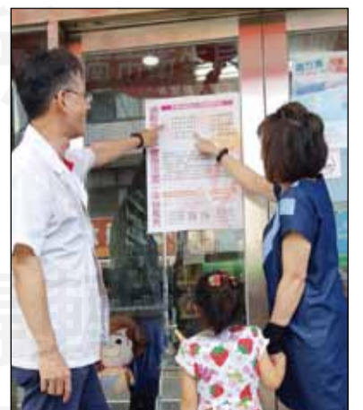
↑藥局張貼「高齡產婦健康守則及早產辨識」相關海報，希望每位高齡孕產媽咪安全生產，寶寶健康出生。

產婦及家人至藥局購買孕產婦、嬰兒相關用品時，給予衛教宣導「高齡產婦健康守則及早產辨識」相關知能，希望每位高齡孕產媽咪安全生產，寶寶健康出生，藥師提醒可利用孕產婦免費關懷諮詢專線0800-870-870（國語諧音：抱緊您，抱緊您）及上衛福部國健署「孕產婦關懷網站」 http://mammy.hpa.gov.tw/ 閱覽孕產期相關知識，希望每位高齡孕產媽咪安全生產，寶寶健康出生。