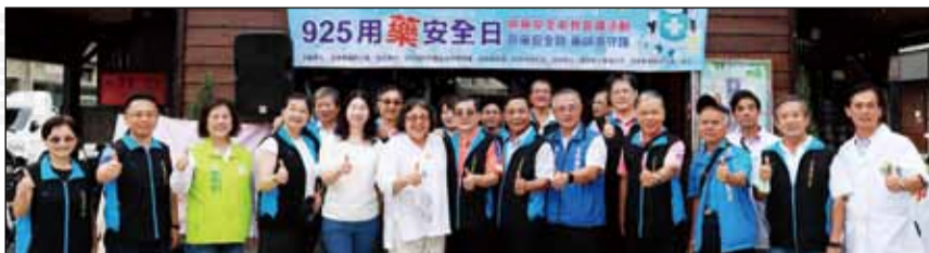
↑雲林縣藥師公會參與925用藥安全日活動，於9月27日設攤舉辦用藥安全宣導。

宣導活動邀請藥師宣講，且廣邀鎮內民眾參與，加強其對於用藥知能，例如用藥五不：不聽、不信、不買、不吃、不推薦；看病找醫師、用藥問藥師，及用藥安