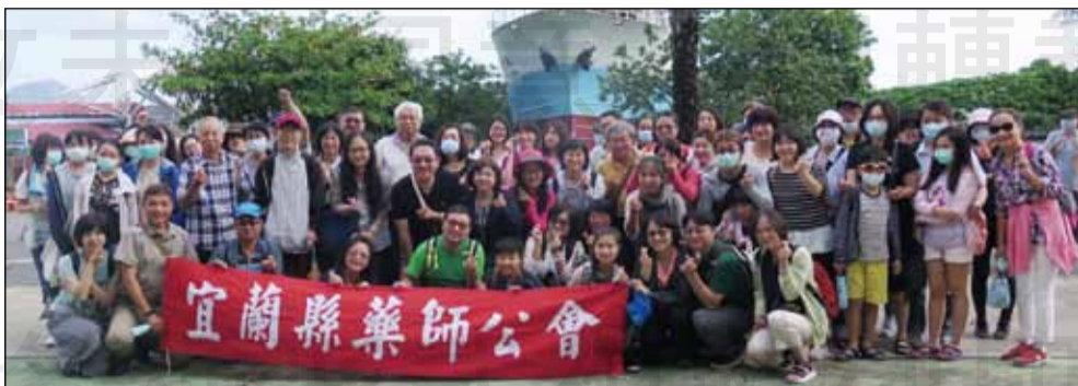
←宜蘭縣藥師公會於9月20日在基隆舉辦會員自強活動。

「新竹風、基隆雨」一年365天，總有265天下雨的基隆，竟然，無雨、微風、陽光小露，真是讓人驚喜，基隆嶼距基隆港約6公里，搭著快艇，由遠漸近，慢慢欣賞有台灣龍珠之稱的基隆嶼外貌。登島後在解說員的解說，並導覽島上特有的角閃石、黑雲母、石英等珍貴的火成岩地質景觀，島上唯一的燈塔成為大展身手的唯一目標。在解說員的介紹下，觀賞到該島的特有種蜥蜴下蛋(一次兩顆)的痕跡，到了直升機的停機坪，解說員風趣地說，它號稱是基隆嶼的國際機場，從停機坪開始，就是基隆嶼唯二的觀光路徑，海景步道及全程由大約1,300階的階梯構成的登山步道，後者的最高點便是黑白相間的燈塔。這天的遊客絡繹不絕，因此上山、下山的遊客在登山步