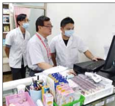
↑苗栗縣於9月17日完成「提升社區藥局專業服務品質及社區民眾正確用藥知能計畫」兩家藥局實地訪查。