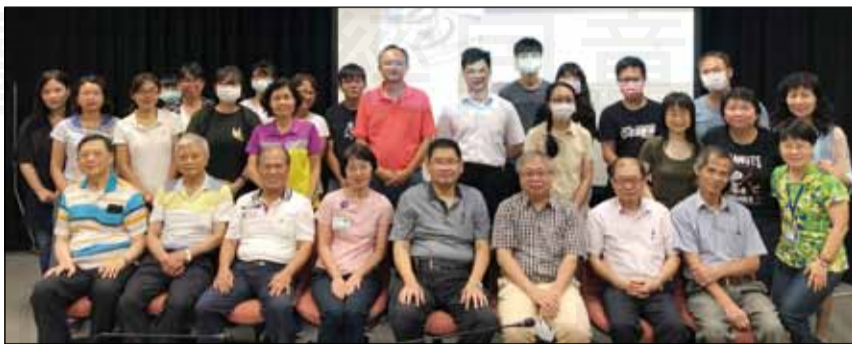
↑彰化縣藥師公會於9月23日舉辦「109年度糖尿病藥事照護暨健康管理計畫」個案討論會暨期中輔導繼續教育課程。

藥 metformin 不變之外，SGLT2 Inhibitors 已躍升至未達控制目標的第一選項。根據實證數據顯示，此類藥品能降低心血管疾病、心衰竭及腎病變之風險，甚至改善其預後。除此，也提醒SU類藥品在初使用患者，建議最多