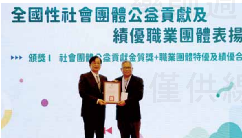
↑內政部次長邱昌嶽(左)11月3日頒發「特優團體」獎予藥師公會全聯會，由理事長黃金舜(右)代表受獎。