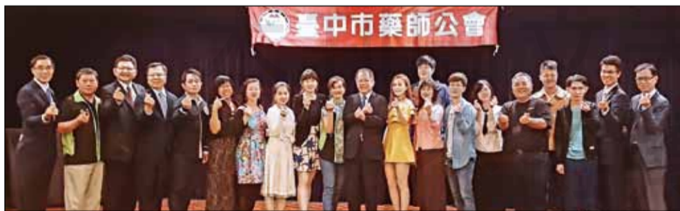
← 臺中市藥師公會於10月25日舉辦「2020閃藥之星卡拉OK歌唱比賽」。