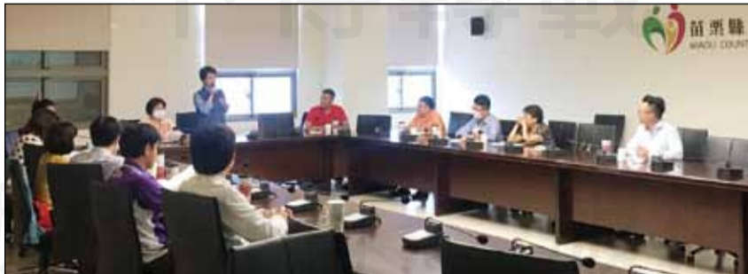
↑苗栗縣藥師公會於10月22日在衛生局召開「用藥整合服務全民健康照護計畫」會議。

苗栗縣扣除無藥師執業的地區，其餘鄉鎮至少都有一間藥局參與此次藥事照護服務；另有十四家長照機構住民的用藥，也都有藥師介入管理，可說兼顧社區與機構的照護需求。這期間衛生局也陸續舉辦相關宣導活動，並在