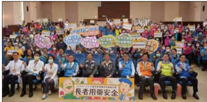
←桃園市藥師公會於10月20日舉辦長者用藥安全知識競賽。

年承辦長者用藥安全知識競賽，在比賽前透過「一據點一藥師」的宣導活動，讓藥師走入社區據點之中，為民眾傳達正確用藥知識的觀念，再鼓勵社區的長者組隊報名競賽。比賽中的題目多元，除用藥、健保促進、長期照顧等