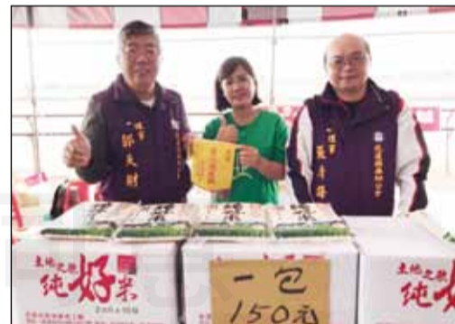
→花蓮縣藥師公會於10月24日協助創世基金會舉辦義賣活動。

更是明顯感受到老年人數遽增，此時藥師在社區扮演著重要的角色。透過參與多項公益活動，希望民眾能對公益有感，且善用藥師資源，提升台灣全民的醫藥品質。