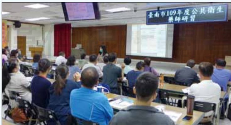
↑台南市政府衛生局於10月18日舉行公共衛生藥師研習活動，期望藉由藥師來協助民眾，做好各項秋冬防疫保健的超前部署工作。

「超前部署」是今年衛生主管機關與醫藥護理人員執行公衛政策最重要的策略，10月18日，台南市政府衛生局召集台南市的藥師舉行公共衛生藥師研習。研討的重點除用藥安全與藥事服務，還包括社區防疫、健康促進、珍愛生命守門人、失智症衛教等多項課題，要藉由與民眾生活圈最接近的藥師，協助做好各項超前部署的工作，讓市民能在今年秋冬平安健康過生活。