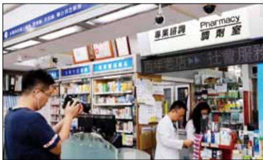
↑全聯會執掌口罩實名制紀錄片導演，於11月2日南下專訪具特色的社區藥局藥師。