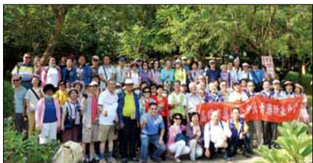
↑ 高雄市藥師公會於10月18日舉辦「109年重陽節長青藥師澄清湖健走」。