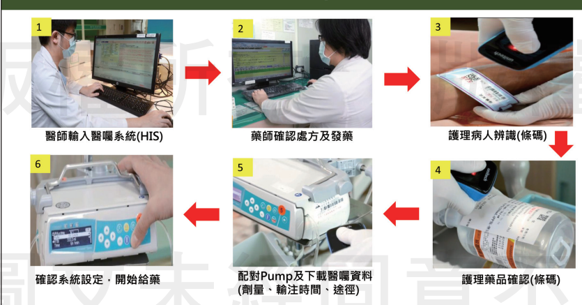
↑雙向智能閉環輸液系統流程。