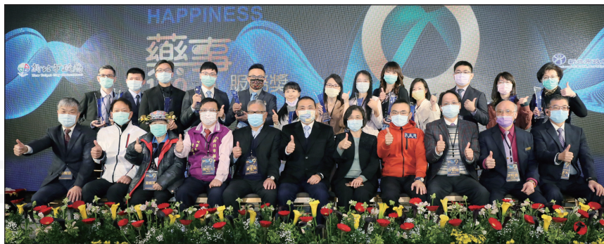
↑新北市政府衛生局於1月18日舉辦「新北市第9屆藥事服務獎頒獎典禮」。

第九屆藥事服務獎由新北市政府邀請藥師公會全聯會理事長黃金舜及各專業領域專業人才組成評審團，從眾多優秀的推薦表