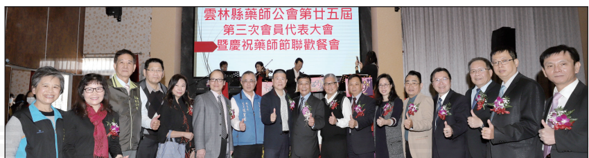
↑雲林縣藥師公會於1月17日舉辦第25屆第三次會員代表大會。

的實質貢獻，參與的藥師大家相當辛苦。在新的一年里，藥師仍要堅守崗位，繼續為民眾付出。