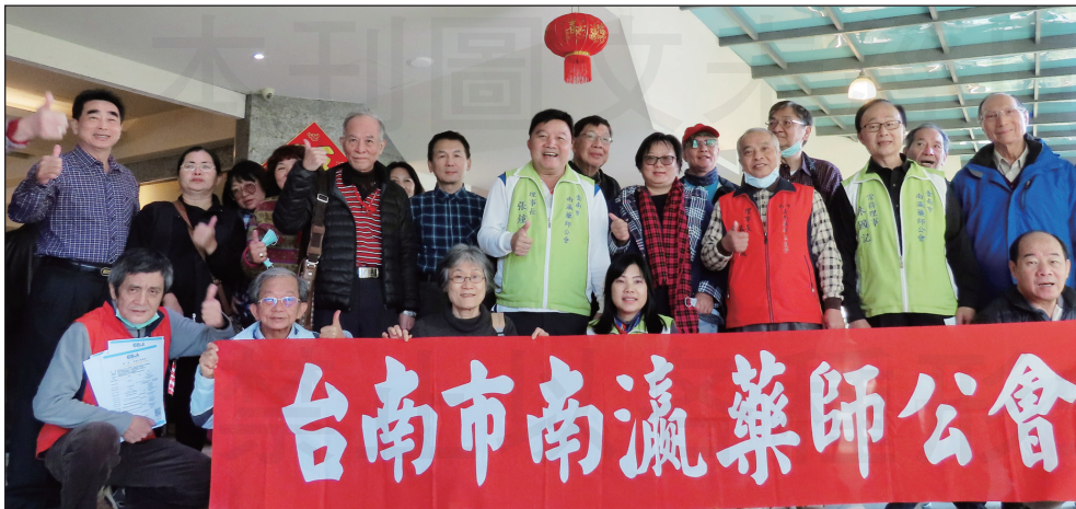
←台南市南瀛藥師公會1月10日於烏山頭舉辦「藥師節聯歡暨健走活動」。