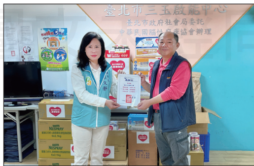
↑臺北市藥師公會於2月6日募集物資送愛心至臺北市三玉啟能中心。

三玉啟能中心，是社會局委託腦性麻痺協會辦理收容包括腦性麻痺者等神經系統構造及精神、心智功能障礙，或是神經、肌肉、骨