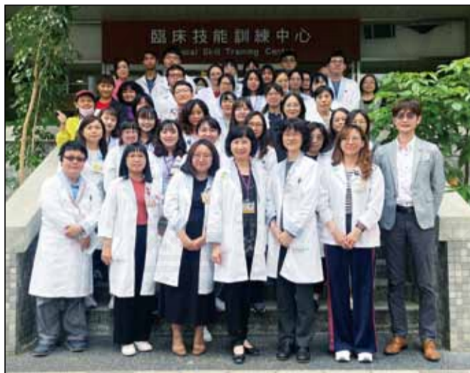
↑高雄長庚藥劑部於3月23日舉行南區教學醫院藥學OSCE聯合訓練。