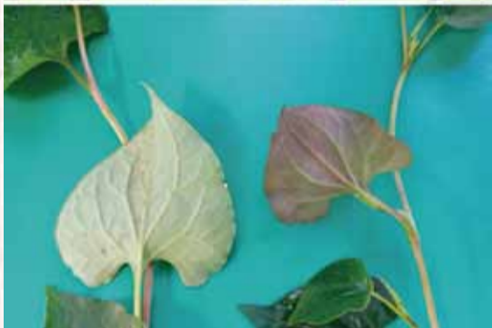
↑民間栽種的魚腥草植物以綠葉種為主 7 。