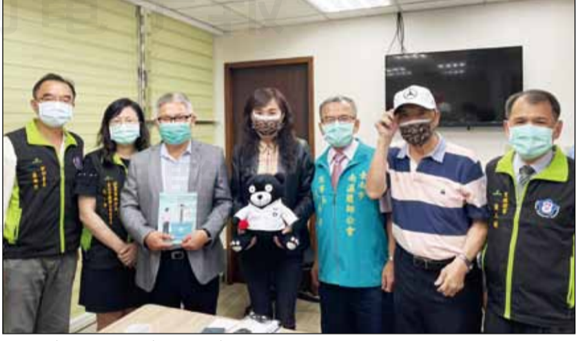
↑全聯會幹部於3月30及31日赴立院拜會教育文化委員會立委吳思瑤(左圖左三)及林宜瑾(右圖中)。

【本刊訊】面對長年未解的中藥用藥安全問題，藥師公會全聯會積極研議對策，希望能根本解決此問題。