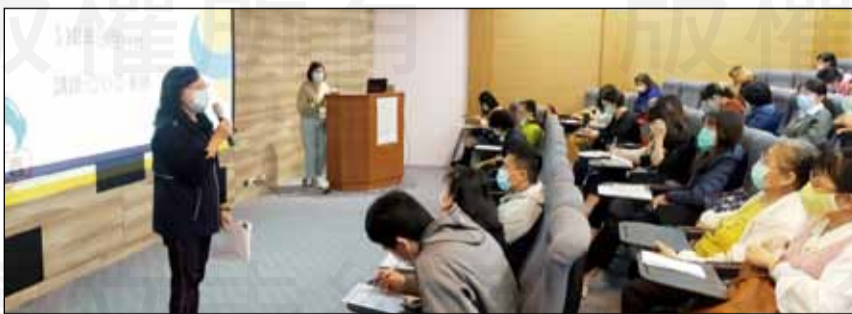
↑台中市衛生局於3月24日舉辦「健康無毒『心』人生 校園反毒宣導」教育訓練。

國內新興精神活性物質推陳出新，目前聯合國已經通報1000多種以上新興毒品，各國列管速度跟不上變形速度，台灣總列管數已來到638項。這些毒品常常以混合的方式出現，最常見的就