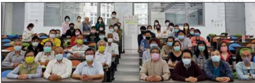
↑110年度社區藥局實習指導藥師培訓研習會，於3月14日及28日在中國醫藥大學舉行。

培訓課程內容區分包括：1.成為適任之社區藥局實習指導藥師必備的特質與訓練。2.執業藥師之人文素養與社會關懷。3.執業中