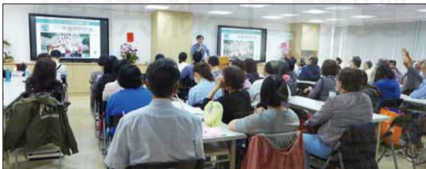
↑台南市藥師公會4月18日繼續教育在新會館舉行，提高學習效果。

一位藥師開玩笑的說：「在公會上繼續教育，就好像聘請家教來家中，個別指導般，很有親切感，與講師的距離沒那麼遠，發問也很方便。」另一位藥師也說：「燈光明亮、設備新，尤其是好幾台86吋的大螢幕輔助，整個學習