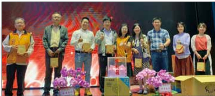
←彰化縣藥師公會於4月17日舉辦第24屆第2次會員代表大會。

全聯會理事長黃金舜不辭辛勞的從台北趕來，在致辭中，肯定全體藥師在疫情中的傑出表現，讓藥師贏得政府的認同，