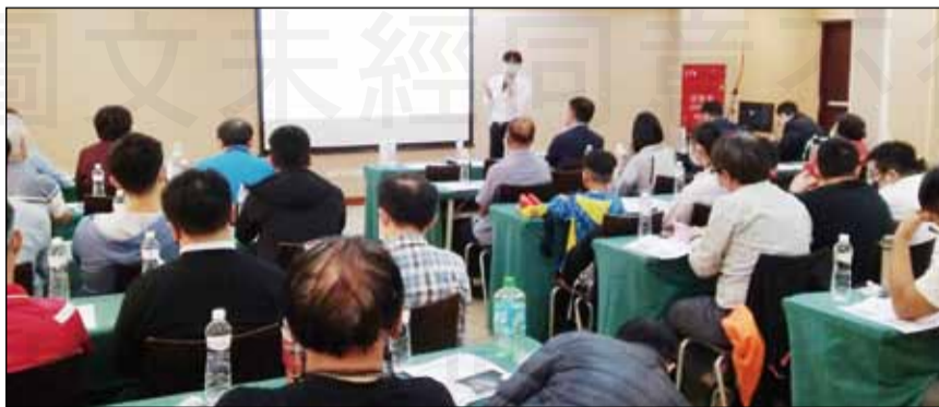
↑苗栗縣藥師公會於4月18日召開用藥整合服務說明會。

課程主題包含用藥指導與溝通諮詢技巧、藥事照護管理系統實務操作教學、用藥整合服務之社區及機構式案例討論，由三位輔導藥師依序介紹此計畫的收案條件、執行用藥整合服務的標準作業流程、示範操作照護管理系統。同時提供相關教案，讓