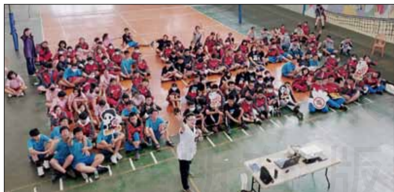
↑雲林藥師於4月8日前往褒忠國中進行宣導。