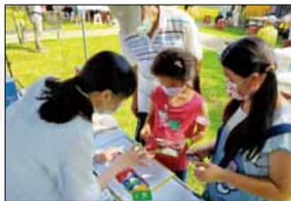
↑響應110年無菸環境宣導暨健康嘉年華，柳營奇美醫院在全程配合防疫措施下，設攤進行中藥用藥安全與反毒相關主題。

中藥用藥安全活動宣導內容包含中藥用藥安全五撇步「停、看、聽、選、用」，強調應停止不當購藥或聽信偏方，如有不適須找中醫診治，並確實聽醫師、藥師說明，購買藥品也應選擇安全、合法之中藥，並遵照醫囑指