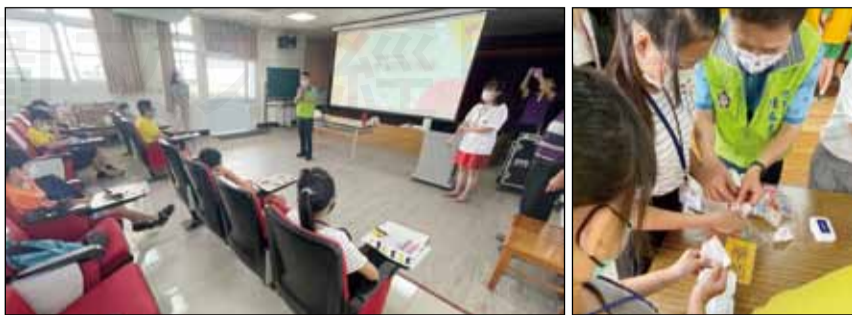
↑兒福聯盟與藥師公會全聯會合作職業體驗營，9月28日於屏東縣港西國小辦理「職業體驗 夢想無限，為愛+值-偏鄉兒少賦能計畫」。

本次職業體驗營邀請港西及同安國小五、六年級學童參與，國小學童提問問題相當踴躍，例如，學童：藥為什麼是苦的？藥