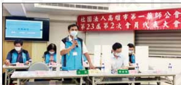
↑高雄市第一藥師公會於9月29日召開第23屆第2次會員代表大會。

師在疫情嚴峻時期，協助政府口罩實名制與防疫酒精的販賣，對於藥師積極參與防疫工作的態度表示肯定。另外，為配合高雄市社會局宣導社會福利政策與推動友善營業場所標章認