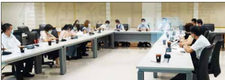
↑高雄市衛生局藥政科於11月5日召開110年度「推動多元藥事照護服務計畫」工作小組期末會議。

目標數略有修正，現階段皆已達成。其中，依藥師可介入分社區式服務共完成86人次（含用藥配合度31人次，判斷式服務55人次）；機構式43人次，醫院－社區藥局轉介25人次；藥師送藥到府及用藥指導21人次。社區及校園用藥安全宣導活動2場；辦理加強麻黃素