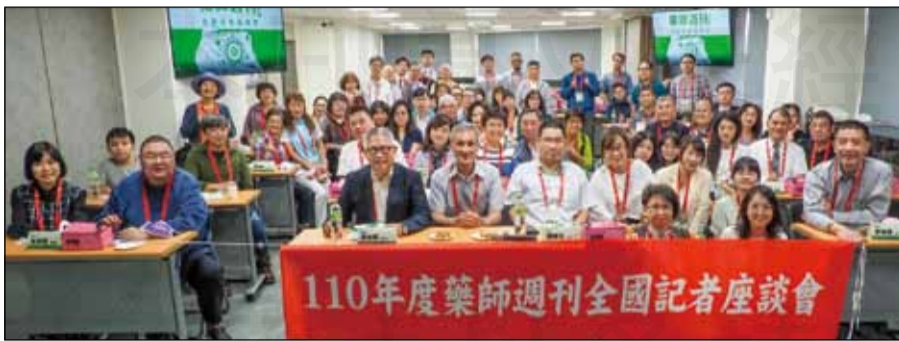
↑藥師週刊於11月7日舉辦「全國記者座談會」，全國記者不遠千里的來共聚一堂，一同學習各項攝影技巧，以精進拍照的能力。