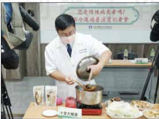
↑藥師公會全聯會在11月5日舉辦「您是慢性病患者嗎？冬令進補要注意」記者會，現場展示十大大補湯以及中藥材，提醒民眾注意冬令進補的中西藥交互作用。

【本刊訊】近日寒風驟起，冬天的氣息漸濃，台灣也即將邁入冬令季節，11月7日適逢「立冬」，俗話說的好「冬令進補，來年打虎」，所以冬季正是進補最佳的時刻，但民眾在食補的過程中，往往會忽略食補中的藥性，因此有慢性病的民眾如果有正在服用藥物的話，須特別注意。 藥師公會全聯會在11月5日舉辦「您是慢性病患者嗎？冬令進補要注意」記者會，現場展示十大大補湯以及中藥材，提醒民眾注意冬令進補的中西藥交互作用。