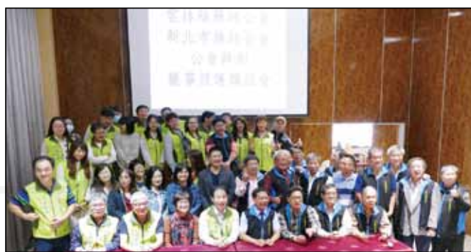
←新北市藥師公會於11月12日至雲林、嘉義進行長照經驗交流。