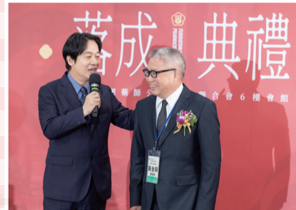
↑ 副總統賴清德致詞時勉勵藥師的辛勞。