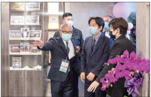
↑副總統賴清德、衛福部長陳時中、食藥署長吳秀梅以及健保署長李伯璋等貴賓蒞臨落成剪綵典禮。 ↑理事長黃金舜帶領副總統賴清德參觀會館。

【本刊訊】期盼已久！全聯會在去年新添購的六樓會館，落成典禮在1月3日舉辦，現場冠蓋雲集，副總統賴清德、衛福部長陳時中、食藥署長吳秀梅、健保署長李伯璋、立法委員吳思瑤、林奕華、王婉諭及多位市議員、本會眾幹部均蒞臨觀禮。 全聯會自民國69年6月28日成立，當時會址設在台北市武昌街一段，民國77年遷至現址5樓辦公，更與新北市藥師公會、省