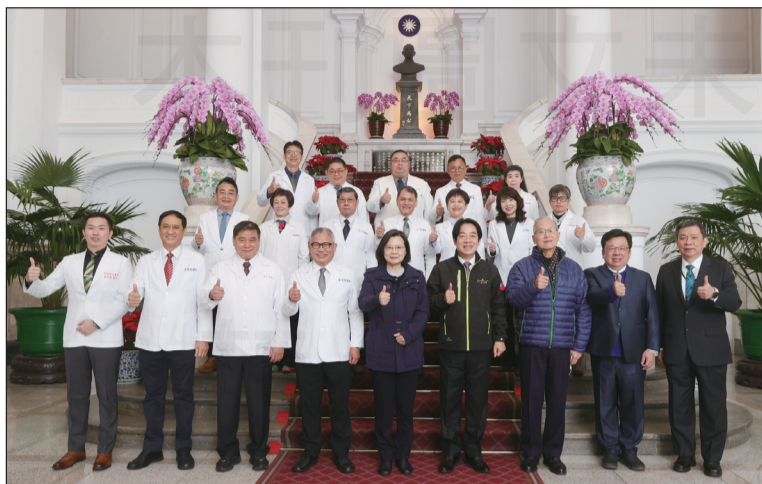
↑ 藥師公會全聯會幹部於元旦參與總統府升旗典禮，並與總統合影。

【本刊訊】隨著跨年倒數，2022年正式來臨，一大清早4點不到，藥師公會全聯會幹部受邀參與醫事團體大合唱與國歌領唱，不畏低溫寒風與細雨，到總統府旁集結，準備表演節目。