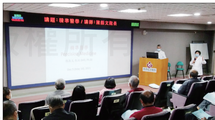
←苗栗縣藥師公會趕在歲末年終辦三週的課程。

此次課程內容涵蓋肺阻塞、心血管、中草藥、生物製劑、精準醫學、各類精神疾病等的介紹，並邀請教授級的講師來上課，提到個人化醫療的概念，像是雖然都罹患同一種癌症，但每個人的基因檢測結果會影響到最