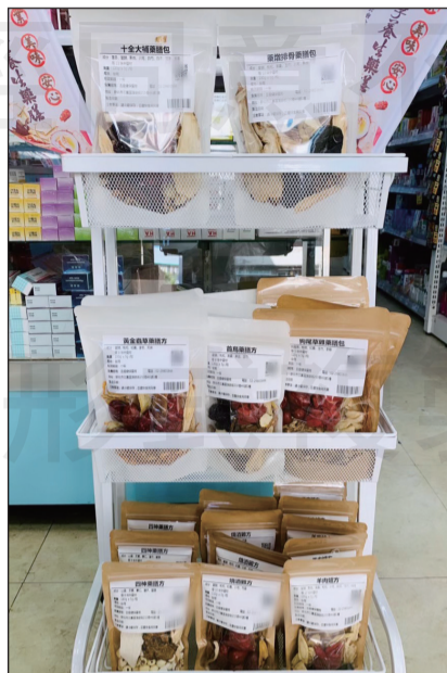
↑各區社區藥局藥膳活動成果—北區(上)、中區(右上)、南區(右中)、東區(右下)。

活動的主軸除了提供民眾好的安心藥膳，也提醒鄉親進行冬令進補的同時，不要忽略了中西藥交互作用的潛在危機，例如：西藥抗凝血劑應減少與當歸、人參等中藥材並用，以免增加出血的風險；藥材也要正確辨認，像首烏排骨湯的「首烏」藥材，經常被混淆品「翼蓼」混用，而藥局藥師提供的何首烏則是正品，