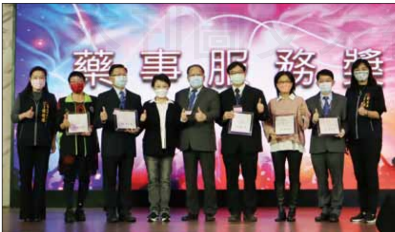
↑台中市市長盧秀燕於1月9日頒發「防疫有功獎」、「藥事服務獎」給臺中市藥師。