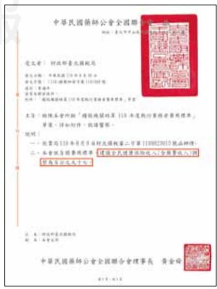
↑藥師公會全聯會於去(110)年8月30日發文至財政部，期能再提高藥師執行業務費用標準，為藥師爭取應得的權益。

全聯會在為藥師開拓各項業務時，也將一併爭取藥師貢獻專業所應得之報酬與回饋，希望此調升費用標準的好消息能夠成為藥師克盡職責、堅守崗位的一大鼓勵。也再次提醒各位藥師，疫情發展仍具許多不確定性，切記謹慎防疫、小心自身安全，也希望藥師能夠持續秉持為民服務的熱忱，成為守護鄰里居民用藥安全的好夥伴。