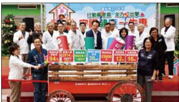
↑嘉義縣於110年12月20日舉辦「行動藥管嘉全方位出擊」成果發表會。