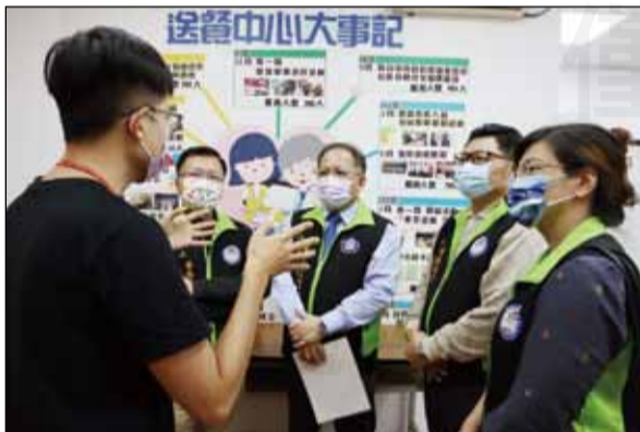
↑臺中市藥師公會在歲末之際捐贈10天的年菜經費，幫助弱勢者過好年。