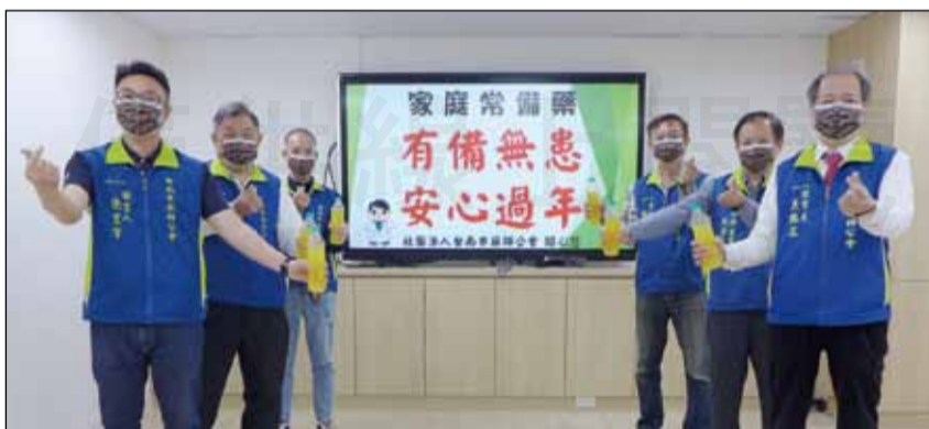
↑南市公會提醒民眾，過年期間不能因為怕塞車憋尿就不喝水，以免尿道炎上身。

春節假期最開心的事是和家人團聚，然而最怕的是小病痛突然來干擾，尤其是半夜時分，診所沒開、很多藥局半夜也沒營業，若是因為一個小病痛就要到醫院掛急診，不只要花很多錢，更會造成急診室的醫療負擔。台南市藥師公會於1月26日發布新聞稿提醒民眾，過年前可先把家庭常備藥備好、外出帶著備用，臨時有小病痛就可先應急使用。