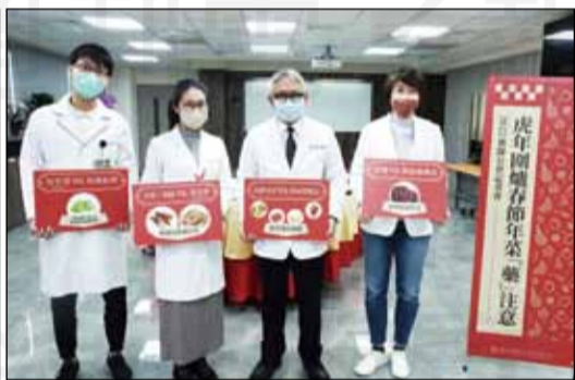
↑藥師公會全聯會於1月19日舉辦春節年菜「藥」注意記者會，提醒民眾要特別留意。獲得6家平面媒體以及5家電子媒體於小年夜至初三報導，充分傳達藥師專業。

【本刊訊】回家和家人一起吃頓年夜飯，是春節華人的重要文化，年菜常見的大魚大肉海鮮等美味佳餚，也要特別注意部份菜色與藥物的交互作用，因此藥師公會全聯會於1月19日舉辦春節年菜「藥」注意記者會，提醒民眾要特別留意。