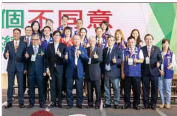
↑高雄市藥師公會於110年12月4日舉辦110年第十四屆第三次會員聯歡晚會。