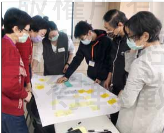
↑臺南市衛生局舉辦「行動醫院公衛藥師培訓」，希望藉由藥界互相討論，找出公衛藥師在行動醫院的定位。

數位曾擔任過行動醫院志工的嘉藥同學，有幸在這兩場的公衛藥師培訓工作坊中擔任活動助手，與多位臺南地區的藥師進行討論踴躍的交流，讓這些新生代藥師正經歷前所未有的火花，因此更願意脫離舒適圈，尋找藥師的新