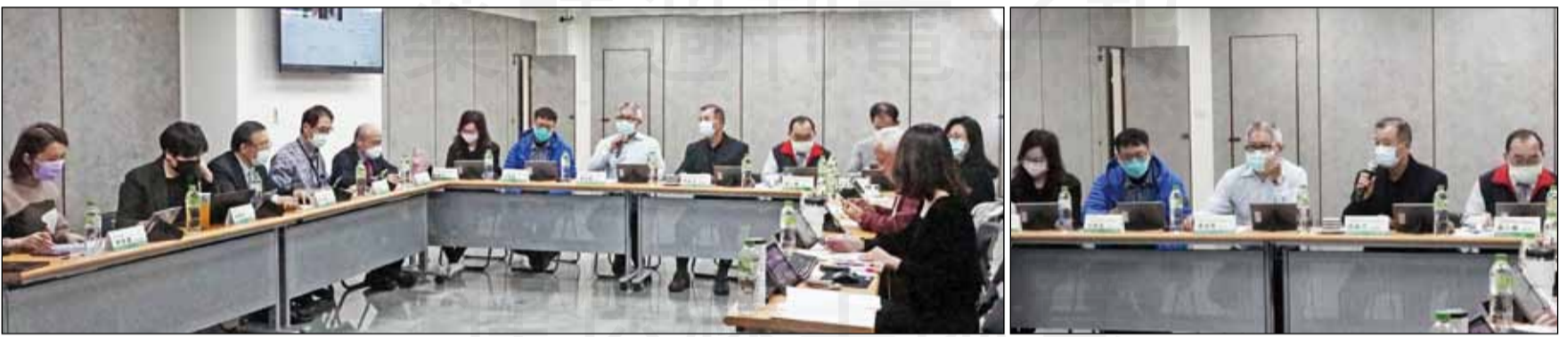
↑藥師公會全聯會於3月8日舉辦「用藥安全路藥師來照護園遊會第一次籌備會議」。

【本刊訊】「用藥安全路，藥師來照護」公益活動，是藥師公會全聯會與食藥署持續定期合作籌辦的大型活動，於103年與107年在自由廣場擴大舉辦，108年則至台中草悟道舉行，期能透過闖關以及抽獎活動，寓教於樂向民眾推廣衛教觀念，讓民眾更了解藥師的角色，獲得正確用藥知識。 今年的「用藥安全路，藥師來照護公益活動」預計6月26日週日在台北圓山花博公園舉辦。