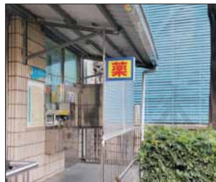
↑戶外慢箋領藥窗口