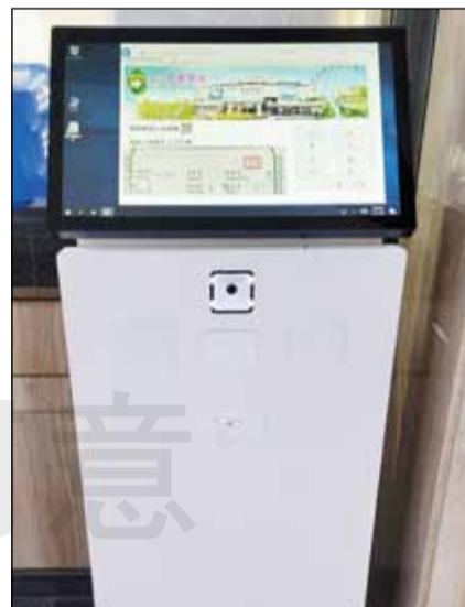
↑多媒體電腦門診用藥查詢機