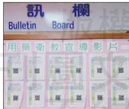
↑用藥宣導QR code連結公告