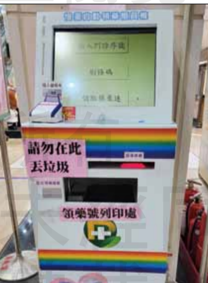
↑電腦自動領藥櫃員機