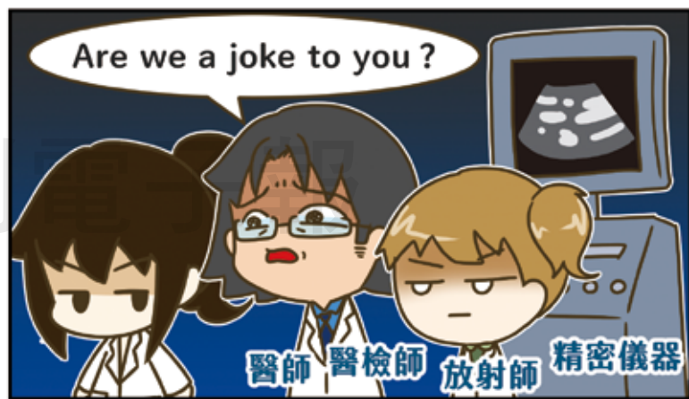
巧婦難為無米之炊，藥師也非無所不知。