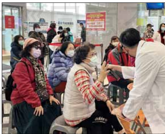
↑每年1月15日的藥師節，雙和醫院藥劑部都會舉辦多項精彩互動活動與民眾共襄盛舉。

「正確用藥，安全有效」攝影比賽：讓民眾拍下心目中認為的「正確用藥」概念並拍下來，除了票選出優勝作品，其他作品也在