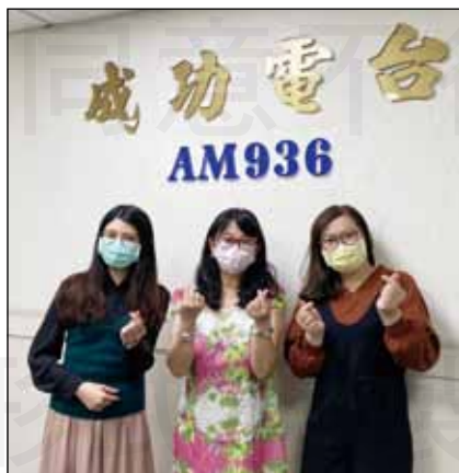
↑高雄電台邀請藥師接受藥物安全專訪。

最近適逢新冠疫苗施打熱潮，與主持人對談當中，藥師特別強調疫苗過敏基本上與過敏體質沒有直接關聯，本身為高風險慢性病人、孕婦、癌症患者等在經過醫師評估後都是可以施打的對象。若在施打後發生較嚴重過敏反應，可以選擇不同種製程生