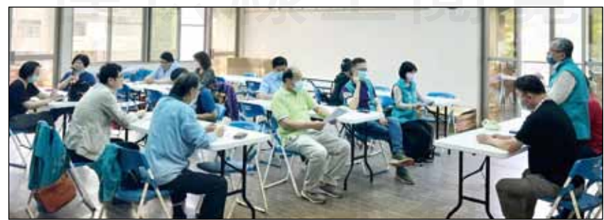
↑台南市南瀛藥師公會於4月17日緊急召開臨時理監事會，討論有關「確診個案居家照護期間，藥師調劑諮詢送藥到府」相關作業。

近日新冠肺炎連幾天破千，確診人數愈來愈多，隨著新冠肺炎流感化，感染者大多以無症狀或輕症居多，為避免醫療能量癱瘓，中