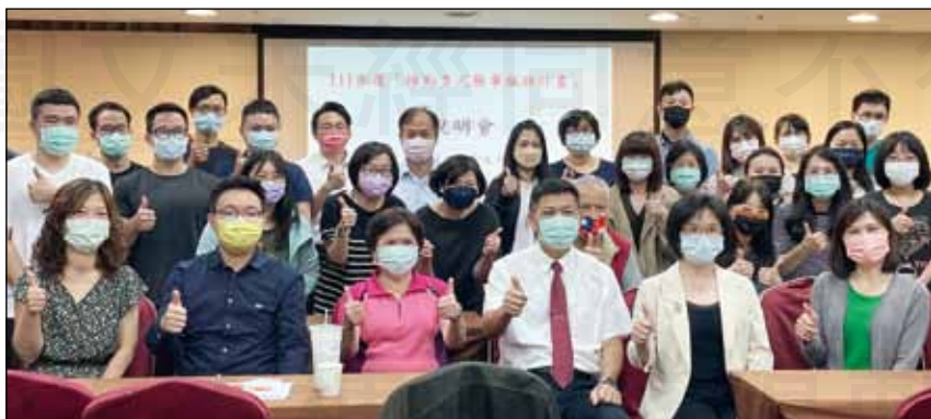
↑苗栗縣藥師公會在4月10日舉辦「推動多元藥事服務計畫」研習活動。

今年與往年不同的是，其計畫內容的評估量表與照護系統都有做更改，今年度是採行遵循醫囑領藥與使用藥物量表(Adherence to Refills and Medications Scale)，簡稱ARMS量表，共有12個問題，分別針對個案的用藥順從性與領藥配合度來做評估，最低12分，最高48分，而分數越低者，代表個案遵從醫囑的程度越高，也就是個案會非常配合的按時領藥和服用藥物，若是超過12分者，代表其配合度不佳，這時可由藥師