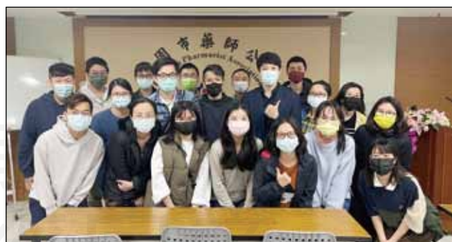
↑桃園市藥師公會年輕藥師委員會於4月16日舉辦衛教資訊圖像化工作坊，精進藥師製作易讀易懂的衛教素材以及簡報的能力。

一整天的課程從理論到實務，每位藥師收穫滿滿，也期待未來能將所學應用於工作之中，製作更接近民眾需求的衛教素材。