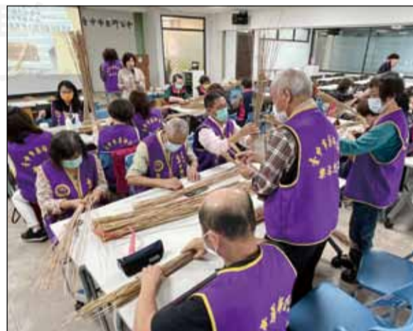
→臺中市藥師公會樂活藥師志工隊於3月中旬舉辦「111年度樂活藥師志工成長課程」。

手作健康「藺草拍打棒」將成為藥事照護C據點的服務器材，可以帶動民眾健康律動操並有效活絡筋骨，藥師志工更從中學習互動，實用又能促進健康，希望大家都能健康並收穫滿滿。