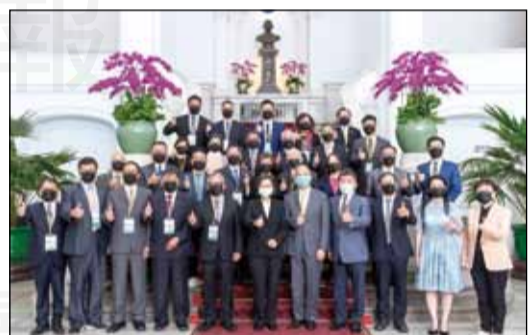
↑藥師公會全聯會理事長黃金舜於4月26日帶領幹部晉見總統蔡英文。

【本刊訊】醫藥分業上路已滿25週年，自86年3月以來，「藥師」在各個角落扮演重要的角色。COVID-19疫情初期，社區藥局在口罩實名制和防疫物資的發放與衛教，成功替台灣擋下一波波的疫情，而藥師守護社區的形象也深植人心；醫院藥師在加護病房提供醫療團隊藥事照護，更完整醫療拼圖；藥師代表今年元旦受邀參加總統府升旗典禮，普遍受到社會大眾的肯定。