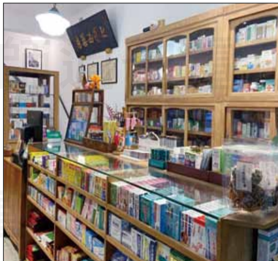
↑七星藥局的空間營造，有別於一般商業處所。