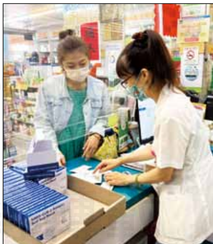
↑自4月28日起，全國將近5,000家健保特約藥局，再次投入公衛工作，代售實名制快篩試劑。

參與防疫，藥師團隊can help，但配套不完善之下，匆促趕鴨子上路，辛苦的是民眾、累的是藥師。期待上級主管機關能聽取基層醫療人員心聲，讓在第一線衝鋒陷陣的社區藥局藥師的專業，不是花在整天與民眾解釋快篩何時到貨！