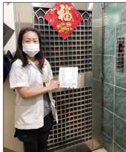
↑桃園市藥師公會於4月16日先行試辦「送藥到宅」服務。

值另一高峰。大家重視全民用藥安全，不在意獎勵報酬，更感謝藥師上山下海，使命必達。