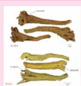
(彩色常用中藥材鑑別圖鑑)

藥材：呈圓錐形，扭曲，長8-30 cm，直徑1-4 cm，表面棕黃色或深黃色，有稀疏的疣狀細根痕，頂有莖痕或殘留的莖基，上部較粗糙，有扭曲的縱皺或不規則的網紋，下部有順紋和細皺。質硬而脆，易折斷，斷面黃色，中間紅棕色。老根中間呈暗棕色或棕黑色，枯朽狀或已成空洞者稱為「枯芩」。新根稱「子芩」或「條芩」。