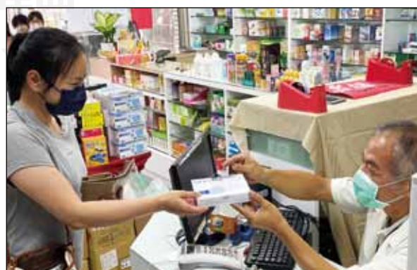
↑全國社區健保藥局藥師於4月28日再次勇敢承接任務，代售政府實施的實名制快篩試劑銷售，為防疫與公衛政策盡力。

口罩實名制、快篩試劑實名制，藥師勇敢承接任務，這樣成功與寶貴的實戰經驗，真的非常值得政府在未來的各項公衛政策上善加利用，藥師是政府的好幫手，不論長照或其他的公衛事務，政府真的不能把藥師邊緣化、忽略化。