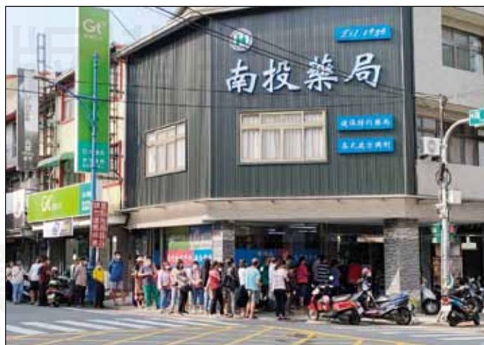
↑南投縣共計92家社區健保藥局積極參與販售快篩試劑實名制。

感謝願意投入販賣快篩試劑實名制之健保特約藥局，藥師接下國家防疫重要任務，就跟當年的口罩實名制一樣，相信全體藥師的汗水可以澆熄這波疫情的延燒。