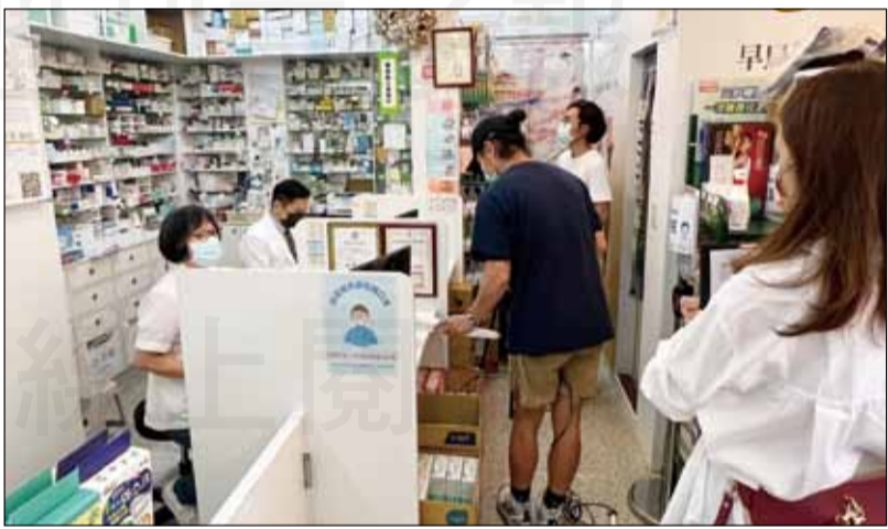
←中央流行病疫情指揮中邀請藥師公會，一同合作拍攝有關於「確診居家照護者，用藥需求免擔心」為主題的宣導影片。

【本刊訊】「大家好，我是XXX，提醒各位民眾…」疫情期間每到整點，電視台、廣播甚至網路，都有輪播指揮中心的防疫資訊廣告，近期因輕症居家照護民眾數量上升，指揮中心也再次邀請藥師公會，一同合作拍攝有關於「確診居家照護者，用藥需求免擔心」為主題的宣導影片，其中對於確診者在家使用健康益友