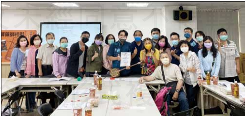
←台南市藥師公會於4月28日舉辦「常用藥局藥妝日語會話」課程。