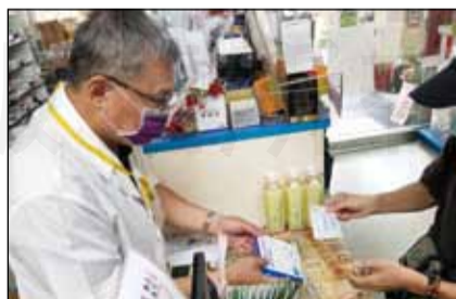
↑高雄市政府首推「快篩試劑兌換券」，自5月3日起，弱勢族群可憑健保卡和兌換券兌換快篩試劑一盒。

市長陳其邁表示，「快篩試劑兌換券」在照顧弱勢族群之餘，也能把資金最有效的運用在防疫