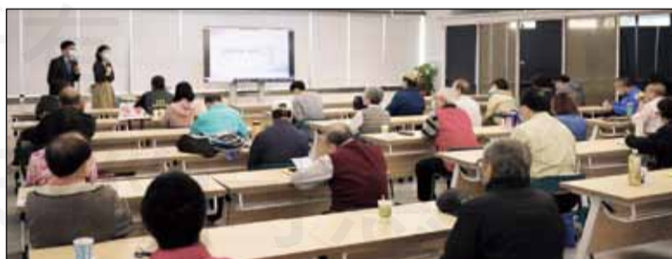
↑台中市新藥師公會於4月16、17日舉辦為期兩天的繼續教育課程。

容相當充實。公會邀請專業的醫師與藥師們，分享新藥與多種疾病治療，像是Ryzodeg FlexTouch，還有熱門的新冠肺炎藥物治療進展與疫苗；在老年醫學則安排失智症治療還有肌少症與銀髮健康照護。在充實自我專業之際，當然也要充實不同領域的知識，因此公會也特別安排包括性別平等與醫院管理等有趣課程。