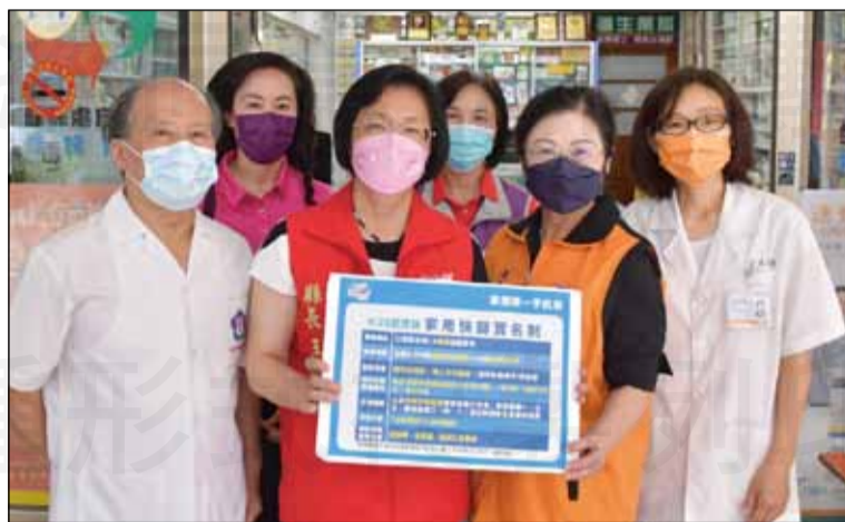
←彰化縣王惠美(左二)縣長關心社區藥局快篩實名制販售情形，在開始販售的第二天(4月29日)早上8點鐘即到花壇善生藥局視察了解。