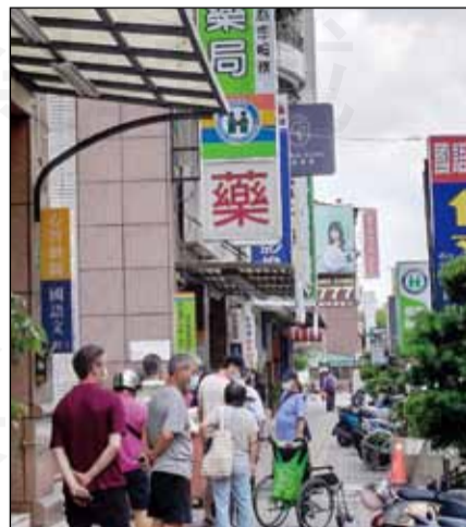
↑連假期間，趕赴各藥局排隊購買實名制快篩試劑的民眾，以利上班時可以使用。

日開門，等到近中午時還未見郵務士送來，趕快撥電話到臺南郵政總局追貨，最後得知當天配送的藥局名單中沒有他的藥局，原來是快篩貨件太多，只能當天要發的快篩試劑當天配達，無法在前一天就可收到貨。