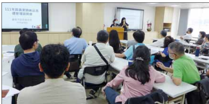
↑為防止含有麻黃素類成分的藥品被不法使用來製毒，臺南市政府衛生局加強對藥師進行宣導說明。

類藥品的販售供應量以每人每次購買七日用量為原則，超出七日期者，藥局應設置簿冊登載購買者姓名、藥名、批號、聯絡方式、購買原因等資料以供查核，避免該藥流於非法用途，以現有市售的包裝規格，大約是每人每次只