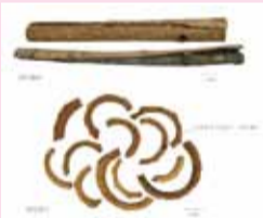
(彩色常用中藥材鑑別圖鑑)

藥材：幹皮呈捲筒狀，雙捲筒狀或板片狀，長30-35cm厚0.2-0.7cm，習稱「筒朴」；近根部的捲筒一端展開如喇叭口13-25cm厚0.3-0.8cm，習稱「靴筒朴」。外表面灰棕色或灰褐色，粗糙，栓皮呈鱗片狀，易剝落，有明顯的橢圓形皮孔跟縱皺紋，刮去粗皮者表面較平坦，顯黃棕色；內表面較平滑，紫棕色或深紫褐色具細密縱紋，用指甲刻劃之顯油痕，質堅硬不易折斷，斷面外部灰棕色，顆粒性；內部紫褐色或棕色，富油性，有時可見多數發亮的細小結晶(厚朴酚結晶)。氣香、味苦帶辛辣感。根皮(根朴)呈單筒狀或不規則塊片，有的劈破，有的彎曲似「雞腸」，習稱「雞腸朴」，長18-32cm，厚0.1-0.3cm，表面灰棕色，有橫紋及縱皺紋，劈破處纖維狀。質硬，較易折斷。嚼之殘渣較多。餘同幹皮。枝皮(枝朴)皮薄呈單筒狀，長10-20cm，厚0.1-0.2cm，表面灰棕色，具皺紋。質脆，易折斷，斷面纖維性。嚼後殘渣亦較多。餘同幹皮。