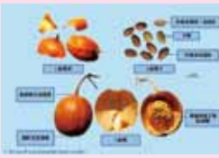
(彩色常用中藥材鑑別圖鑑)

藥材：果實呈類球形或寬橢圓形，長7-15cm，直徑6-10cm。表面橙紅色或橙黃色，皺縮或較光滑，輕重不一。質脆，易破開，內表面黃白色，有紅黃色絲絡，果瓢橙黃色，黏稠，與多數種子粘結成團，當果實表面有白粉，變成淡黃色時，分批採摘，懸通風處晾乾。