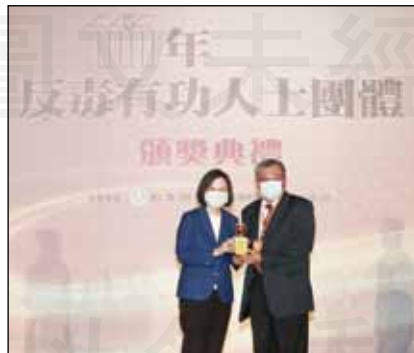
↑ 高雄市藥師公會榮獲111年全國反毒有功團體，由總統蔡英文頒發獎盃。

總統蔡英文表示，毒品防制是政府工作的重中之重，今天現場集合跨部會的首長和同仁，除表揚反毒有功的夥伴及團體，也要一起展現政府反毒的決心。並重申，面對毒品絕對零容忍，政府會持續整合各方資源，全力落實防毒、拒毒、緝毒、戒毒工作，並表示行政