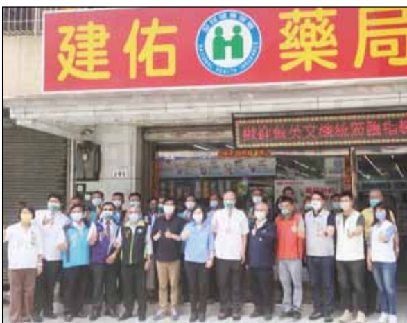
↑蔡英文總統於7月22日前往高雄市訪視「送藥到府」，肯定藥事人員不辭辛勞提供送藥到府服務，守護人民健康。