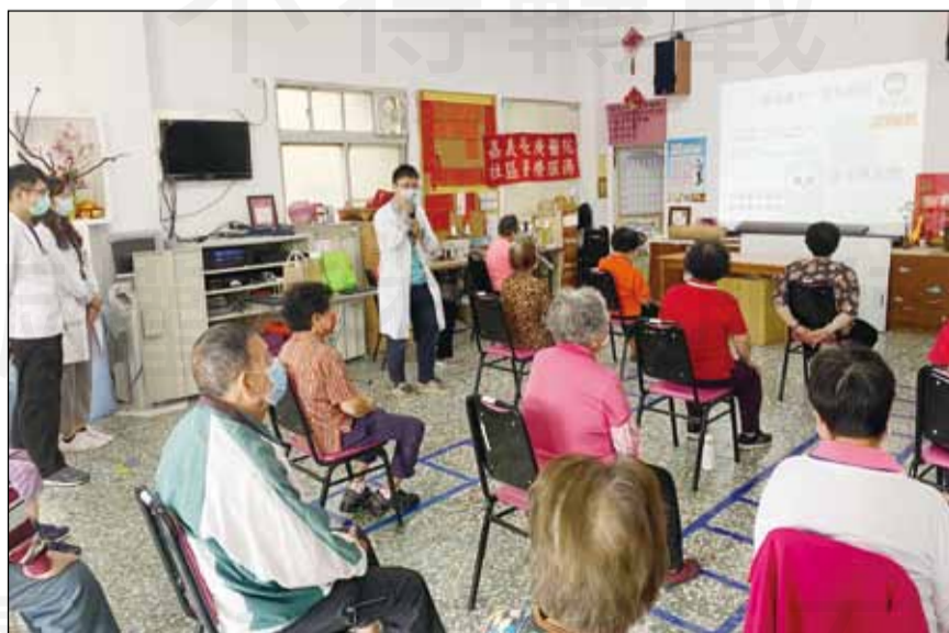
↑嘉義長庚醫院藥師至嘉義縣太保市民眾服務社宣導用藥安全。

明的藥、注意自身的健康、看診時清楚說出個人身體狀況以及定期量血壓並提交紀錄給醫師評估