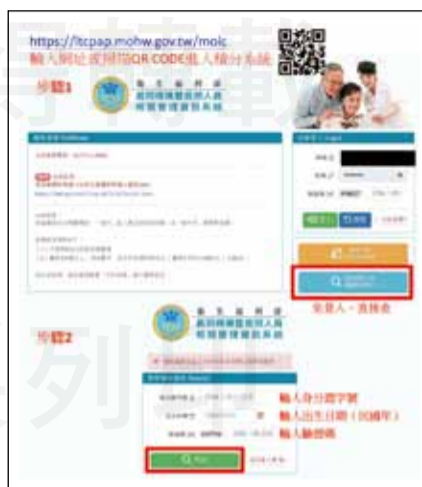
↑圖二 長照積分系統查詢步驟。

教育之證明文件。逾有效期限申請更新者，其依前項第三款規定檢具之證明文件，以申請更新日前六年內完成第九條第一項所定繼續教育之證明文件代之。藥師們，六年歲月如梭，若有缺相關學分請盡速補齊，以利長照人員換照。