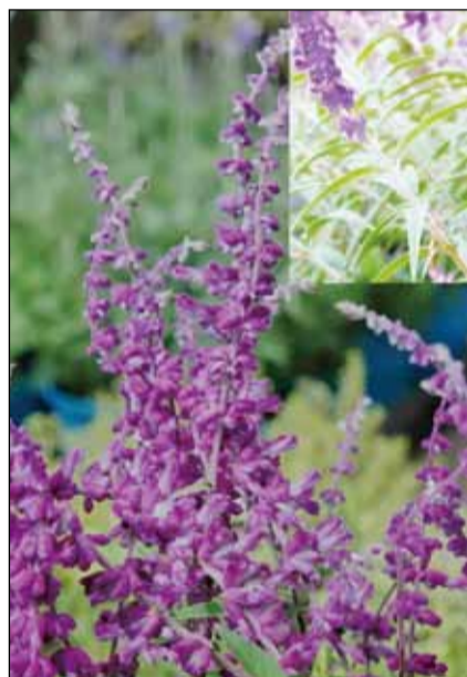
↑墨西哥鼠尾草。

墨西哥鼠尾草 Salvia divinorum ，俗名預言者鼠尾草、先知鼠尾草，是一種唇形科、鼠尾草屬的植物，又名迷幻鼠尾草；是屬於亞熱帶、多年生的草本植物，喜愛濕熱(15~27°C)環境，長相和薰衣草有些類似，較為高大，長得很快，6個月內可長到2公尺高，會開出紫紅色的花朵。居家種植很容易，避免強烈日照，沒有特別的香味，很難以查覺。內含活性成分 Salvinorin A