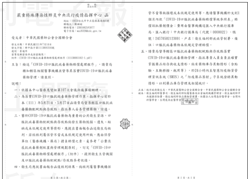
↑指揮中心於7月14日發布公文，要求藥局與各醫療院所確實管理COVID-19口服抗病毒藥物。全聯會已行文指揮中心表達意見。

針對日前公告「COVID-19口服抗病毒藥物賠償處理程序」引起藥師廣泛討論一事，指揮官王必勝回應，指揮中心有職責和義務對於防疫物資擬定管理辦法，