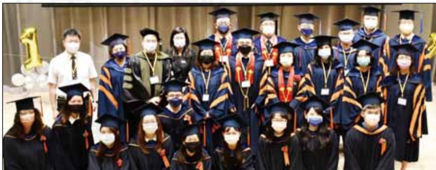
↑碩士班畢業生和師長合照。