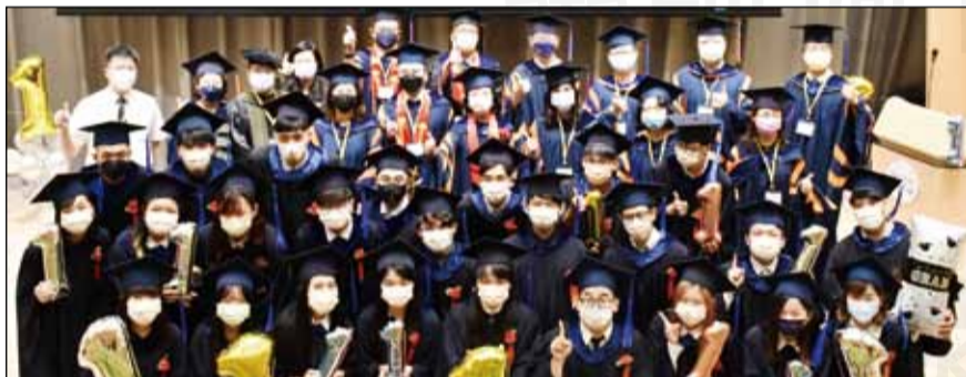
↑大學部畢業生和師長合照。