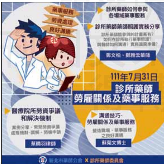
↑ 「診所藥師勞雇關係及藥師服務」課程表。

勞雇關係始於訂立勞動契約（不限書面），藥師應徵職務一般屬於繼續性工作，為不定期契約，所以應符合法定事由方能終止勞動契約；而藥師受雇應受勞基法保障，須符合正常工時，而非責任制；藥師適用勞基法的前提，是有具從屬性的勞動契約，但當聘僱關係、委任關係有爭議時，是以「個案事實」加以認定，並不拘泥於契約表面文字。受雇藥師遇國定假日，約定補休對調是1日對1日，雇主不需付加倍工資，但當遇到休假等爭執時，雇主須負舉證責任。還有最常遇到的最低服務年限約定，需符合雇主為勞工提供專業培訓費用或履約應提供合理補償，上述二擇一，且不逾必要性及合理性，違反者約定無效。當遇到勞資糾紛時，勞資爭議的解決管道有申