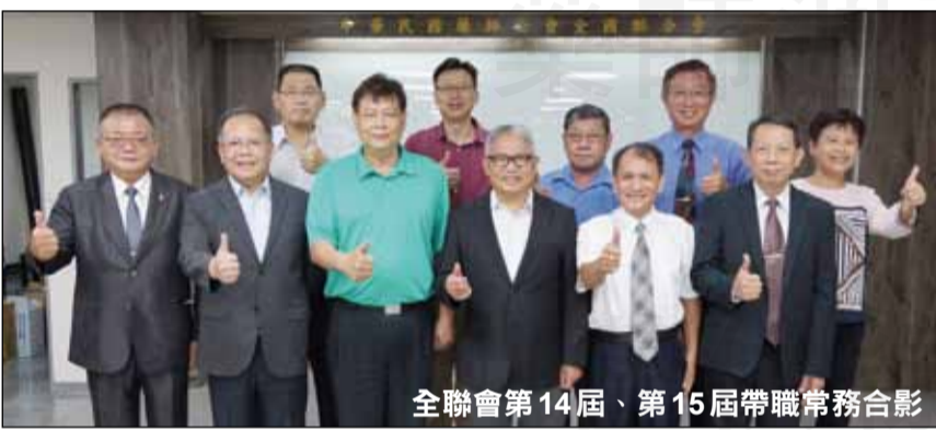
全聯會第14屆、第15屆帶職常務合影