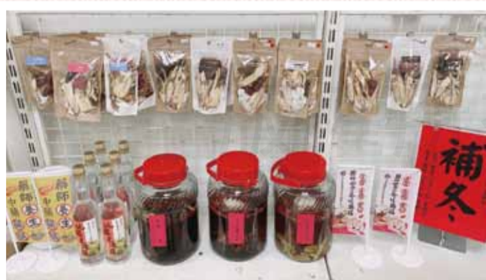
↑「補冬」二個字的紅紙最能傳達藥膳包食補的意涵，在藥膳包的陳列處附近或是在藥局入口處貼上這樣一張紅紙，都會具有畫龍點睛的廣告效果。

若是藥膳包陳列的空間條件許可，加個中藥相關的裝飾物件搭襯，例如擺上一個存放中藥丸的大大彩繪瓷罐或是立起一支傳統秤藥材的「戥仔」，或是將各種不同的藥材用玻璃製的種子瓶、中藥罐展示陳列出來，再加個投射燈，來點聲光影音效果，那絕對可以把藥膳包塑造成一種實用的精品，創造「藥師做中藥」藥膳包應有的利潤價值。