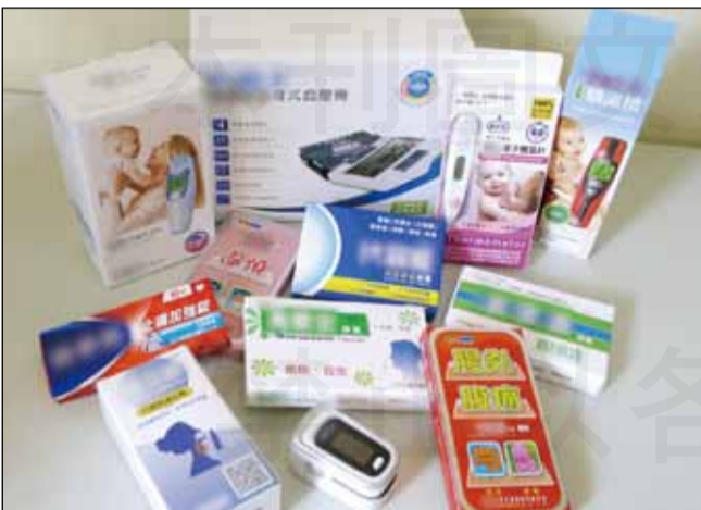
↑這波病毒更加兇猛，台南市藥師公會提醒民眾勤洗手、戴口罩、打疫苗，家中可先備好「3機6藥」，以利及時因應。