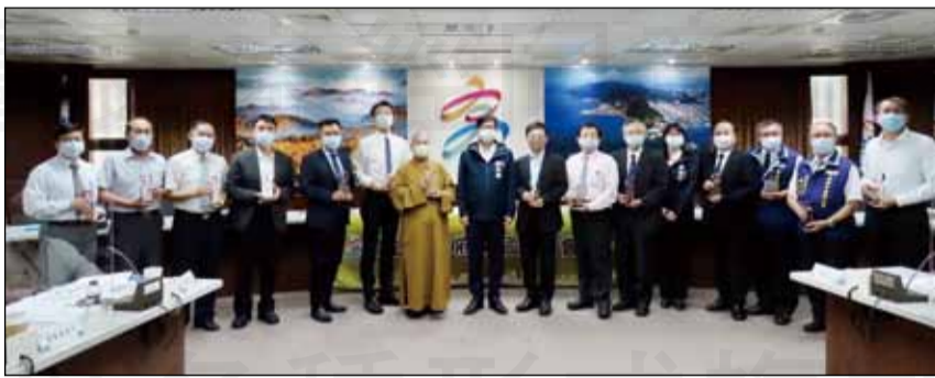
↑高雄市長陳其邁於8月25日「高雄市政府毒品防制會報」特別頒發感謝獎座給17位府外委員。

強化涉毒兒少保護機制、「點亮家中溫暖燈」計畫、戒癮醫療全國唯一加碼補助、提升醫療資源利用率、強化多元輔導、提早入監銜接輔導減少失聯、強化治安緝毒