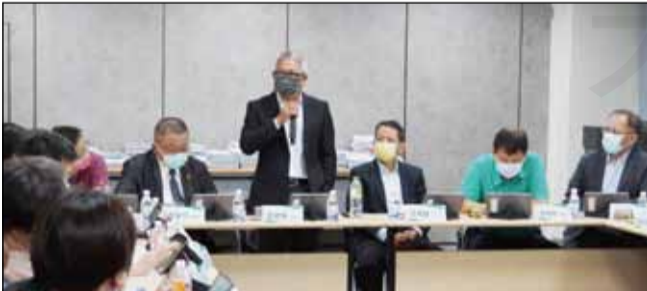
↑藥師公會全聯會於9月23日召開第十五屆第一次常務理監事會議。