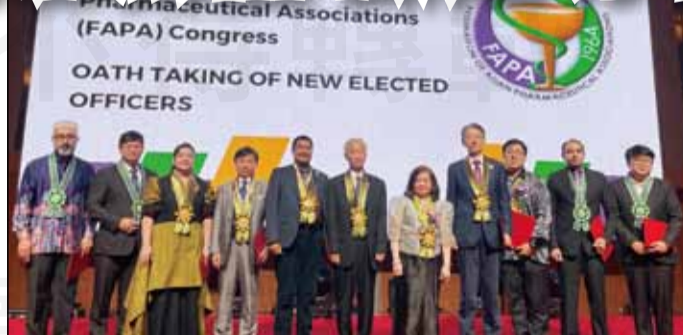
↑大會為所有來賓介紹FAPA新一屆的委員成員。