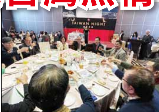
↑2022台灣之夜(Taiwan night)活動於11月11日晚間展開，共15個國家與會，235位藥師參加。