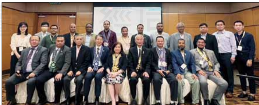
↑優良藥事執業論壇與會者合影。

此訓練課程計畫係源於前任亞洲藥學會會長王文甫之發想而建構，有鑒於多年觀察發現亞洲各國藥事執業環境與水準差異甚