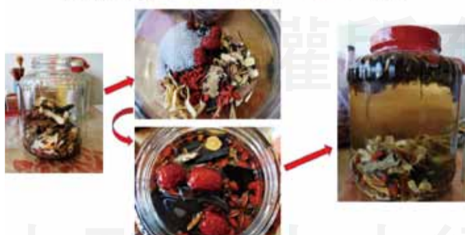
泡藥酒流程-填入藥材、倒入白酒

↑藥酒初浸泡時，液面不會有立即的變化，但藥材會慢慢將白酒的水份吸收，酒的液面會下降，浸泡完成時，就需再做補酒的動作。