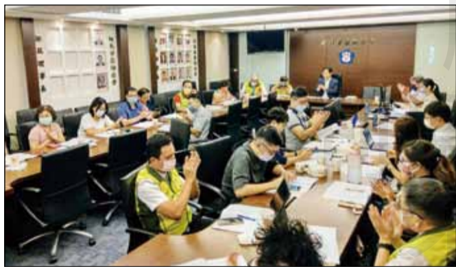
←新北市藥師公會召開「第四屆第七次理監事聯席會議」，會中討論改組第四屆慢箋送贈品懲戒委員會名單。

憑處方箋贈送物品處置辦法第三條第一項辦理，本會懲戒委員會設置委員9~15人，委員會應就理監事會中至少7人、法學專家學者或社會人士2人組成。