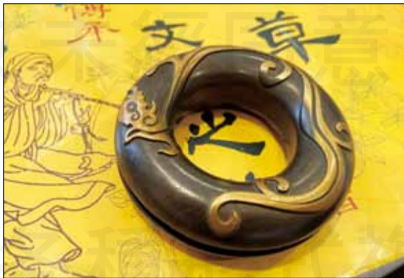
↑虎撐又叫做「虎銜」、「報君知」、「串鈴」、「藥鈴」等，是古代游醫的標準配備。

說孫思邈有一次在山中採藥時迎面碰上老虎，他心想這下子完蛋了，恐怕要命喪「虎口」了，人生的跑馬燈都開始跑起來了！奇怪的是老虎並沒有配合他的內心戲撲上身來，反而是緩緩張開大嘴蹲在地上。這下子孫思邈被搞懵了，等到三魂七魄歸位後，他才看見老虎的咽喉中卡著一根動物的骨頭，想必是老虎享用的肉肉大餐並沒有去骨服務，虎吞虎嚙之下造成的食安問題。