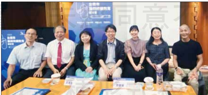
↑由台南市藥師公會、成大醫院藥劑部共同主辦的繼續教育課程，吸引近2,000人線上同時研習。

問題，因此，目前糖尿病共照網也開始與腎臟病共照相結合，人體的每個腎臟是由100萬個腎元所組成，隨著年齡增長，腎元會開始萎縮減少，然而，因為腎臟病