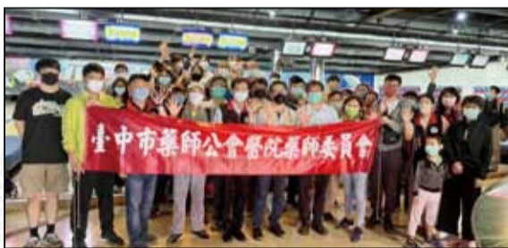
↑ 臺中市藥師公會於10月23日舉辦111年度保齡球大賽。