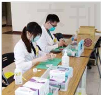
↑ 藥師協助抽取疫苗。