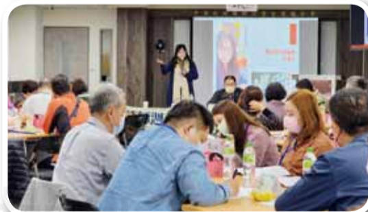
↑藥師週刊總編輯分享「許一個好看好讀的週刊」，讓更多人能夠加入欣賞與閱讀藥師週刊的行列。

總編輯同時教導記者必須具備敏銳的嗅覺，在第一時間嗅出可發揮題材，在不抄襲、不過度解讀或引用他人評論的文章，認真書寫、真實呈現、確實檢查後，做正確的報導。