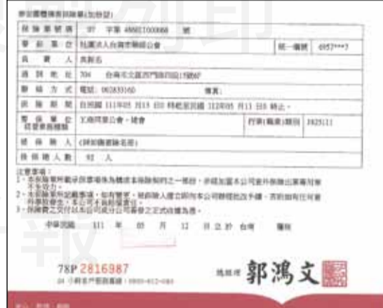
↑台南市藥師公會在執行「送藥到府」任務初期，即為台南市報名執行這項任務的92名藥師投保團體保險與意外險，讓藥師多一點保障。