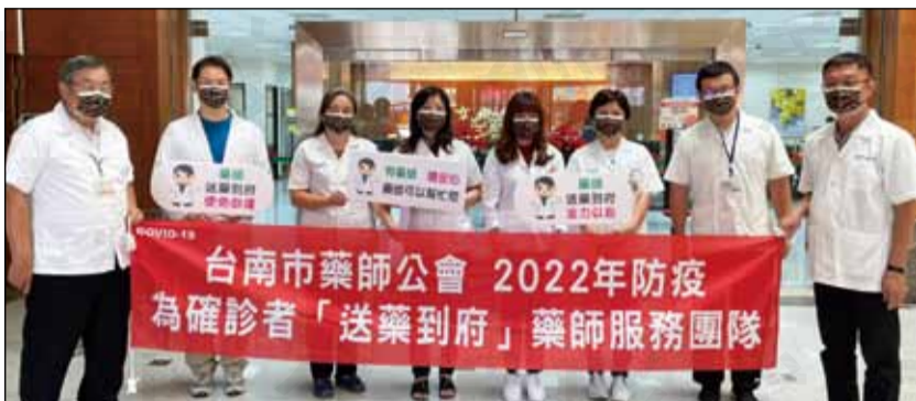
↑有藥師請安心，「全力以赴、使命必達」是台南市藥師公會為確診者送藥到府團隊奮不顧身、勇往直前的目標，只為讓市民更快獲得平安健康。

台南市藥師公會因深知這項任務不容易，執行任務的藥師承擔極高風險，但又不得不勇於承擔這項真正對政府穩定民心、對病患病情有助的神聖使命，於是，在五月初任務執行初期，即為自願報名執行這項送藥到府任務的92名藥師投保團體保險與意外險，讓這群藥師多一點保障。