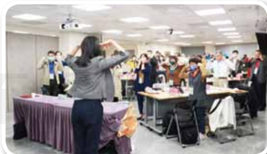
↑藥師記者需培養敏銳觀察力。