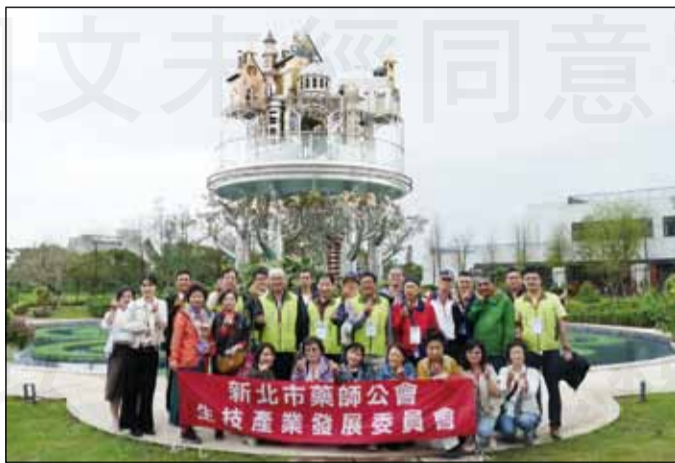
↑新北市藥師公會於11月23日安排杏輝藥廠與赫蒂法莊園參訪。

結束杏輝參訪，下午則前往五結鄉佔地約6000坪的療癒生態園區「赫蒂法莊園」，於2021年4月開放入園參觀，是亞洲首座結合樂活養生、醫學美容與生態園林科學的生技觀光園區。由董事長謝偉斌親自簡報，其關係企業有順天堂、寶齡富錦、法國SVR醫美保養品