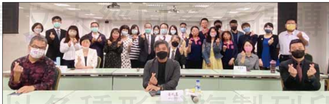
←台灣臨床藥學會於10月14日舉辦第五屆台灣教學醫院藥事作業實踐巴塞爾聲明微電影創意決賽。

什麼是巴塞爾聲明？世界藥學會於2008年在瑞士巴塞爾舉行FIP Congress in Basel，制定醫院藥學未來發展的準則，稱之為巴塞爾聲明(Basel Statement)，包含六大主題：醫院藥師與採購；醫院藥師對處方的影響；醫院藥師與藥品配製和配送；醫院藥師與給藥；用藥監測。醫院藥師人力資源配