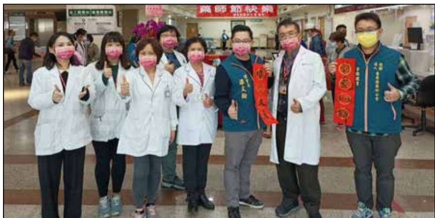
↑ 苗栗縣藥師公會於1月13日，舉辦「藥健康、藥安全、藥樂智」迎春送暖慶祝活動，與民眾共享藥師節歡樂的氣氛。

家中藥物是否有過期，包括口服錠劑、藥水、外用藥膏、紗布、OK繃，都要定期清理，若有需丟棄的一般藥品，可依照「倒、沖、集、混、封、回」六步驟來處理。分別是「倒」把過期的藥水倒進夾鏈袋中；「沖」藥罐用水沖洗一下，沖洗過的水也要倒進夾鏈袋中；「集」把過期的藥丸從包裝中取出，全部放在夾鏈袋內；「混」將泡過的茶葉、咖啡渣或擦手紙，與藥丸及藥水混合在一起；「封」把夾鏈袋密封起來後，再跟一般垃圾一起丟棄即可；「回」剩餘的藥袋與藥罐要回收處理，至於一些較特殊的藥品，像是抗生素、管制藥品、抗腫瘤藥物、賀爾蒙藥品，因為其毒性