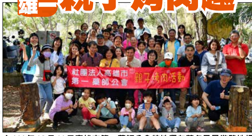
↑111年12月11日高雄市第一藥師公會特地選在著名風景遊憩地標澄清湖舉辦親子烤肉活動。