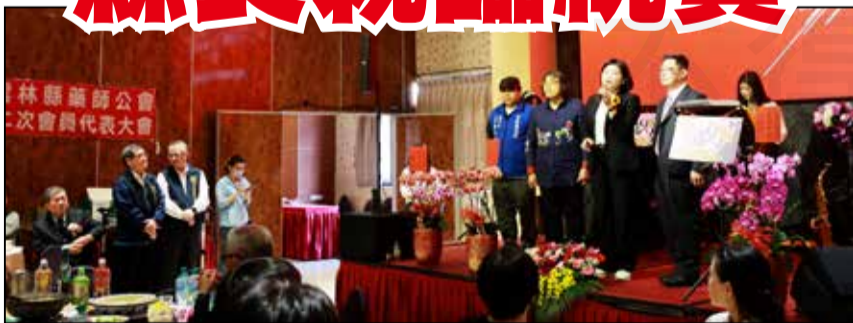
↑雲林縣藥師公會於1月15日舉辦第26屆第2次會員代表大會暨慶祝藥師節聯歡餐會。