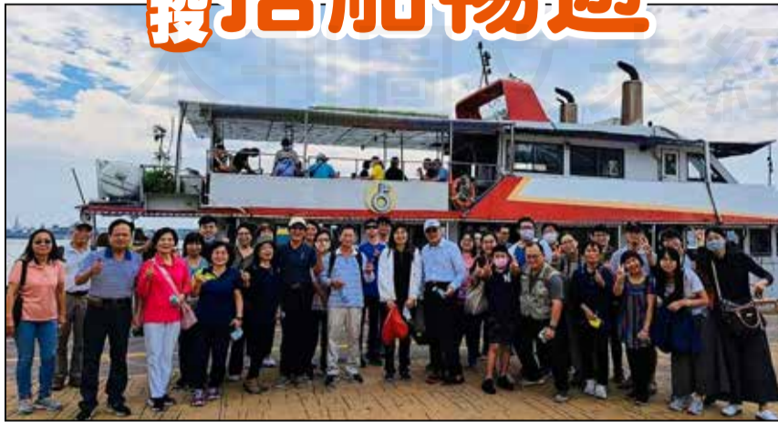
↑因為疫情影響，南投縣藥師公會連續兩年停辦藥師自強活動終於在111年11月27日恢復舉辦。