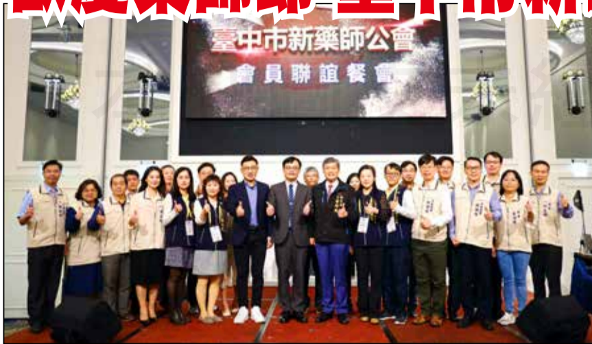
↑臺中市新藥師公會於1月15日藥師節，盛大舉辦會員聯誼餐會，並頒發資深藥師與績優藥師等獎項給優良藥師、會徽得獎者。