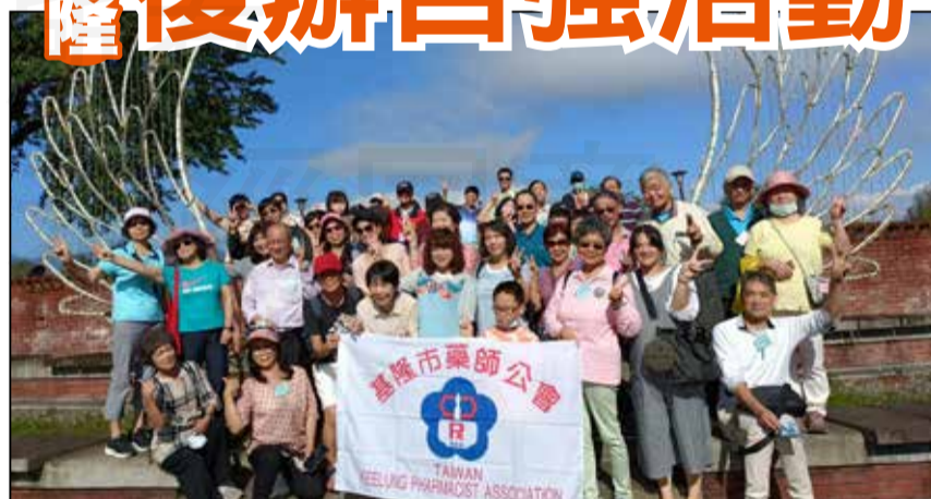
↑基隆市藥師公會111年復辦自強活動，規畫宜蘭一日遊。