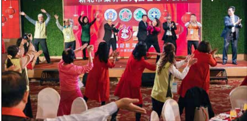
↑ 1月11日舉辦新北市四大藥業公會（新北市藥師公會、藥劑生公會、西藥商業同業公會、西藥服務職業工會）忘年餐會暨慶祝藥師節聯歡晚會。