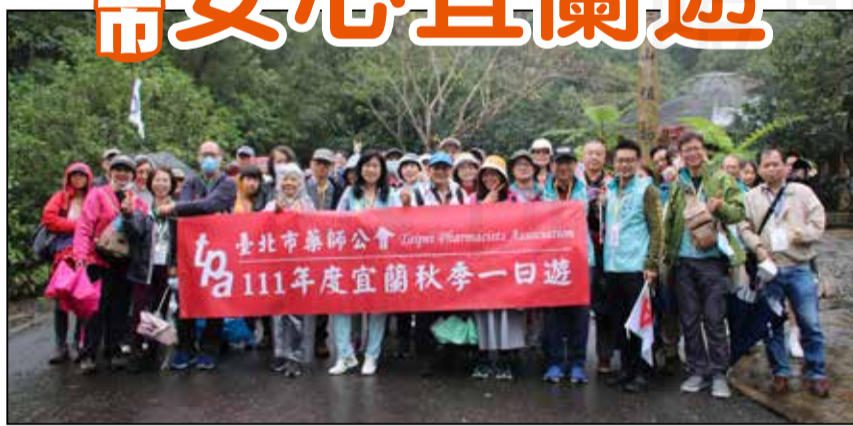
↑臺北市藥師公會於111年12月4日舉辦宜蘭秋季一日遊。幹部及會員於仁山植物園合影。