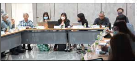
↑亞洲藥學會總部於2月11~13日派員，來台場勘台北國際會議中心(TICC)，並在2月13日上午參與2023 FAPA年會第二次籌備會議。