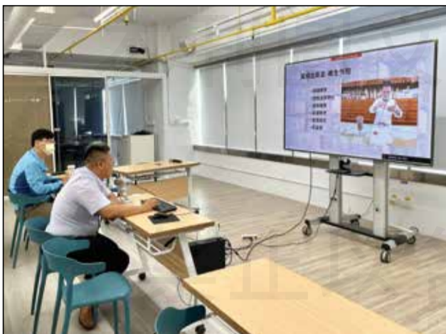
↑臺中市新藥師公會舉辦線上繼續教育課程，由三個委員會共同籌畫講座。