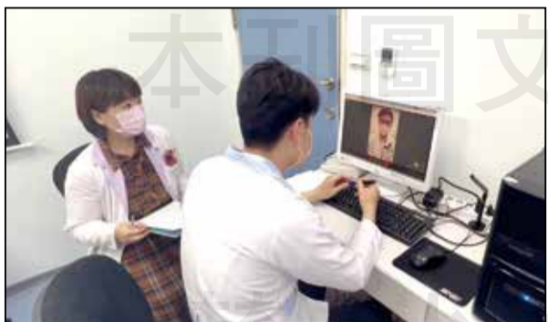
↑藥劑科學員與住院醫師視訊進行藥物諮詢，考官在旁考核(左)。