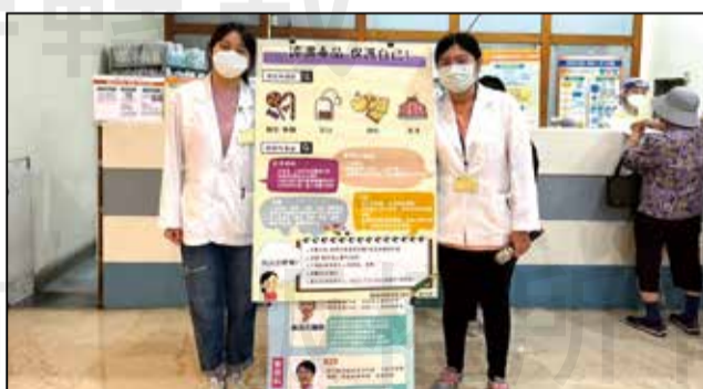
↑ 大里仁愛醫院於門診候藥區舉辦「認識毒品，保護自己」衛教講座。