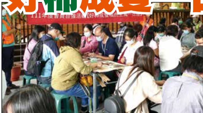
↑新北市藥師公會於111年11月20日舉辦111年度會員自強活動「好柿成雙福虎生風一日遊」。