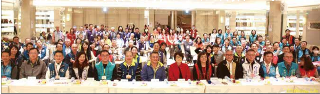
↑由全聯會理事長黃金舜帶領與會各縣市理事長一字排開，台東縣長饒慶鈴與在場所有幹部留下難得紀錄。