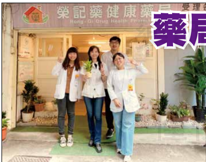
↑藥學生從指導藥師身上不僅能學習到藥物的相關知識、法規及藥局的經營管理，還有藥師的經驗分享。

目前教案已標準化，將持續做為未來教學訓練之用，也期待更多單位的加入，讓更多學員可以獲得更多層面的學習。