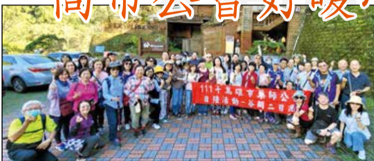
↑高雄市藥師公會舉辦111年度自強活動兩日遊。