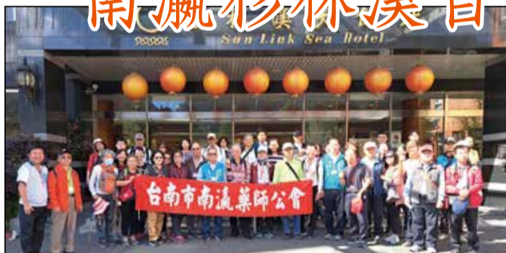
↑台南市南瀛藥師公會於111年12月4日舉辦「杉林溪自強活動一日遊」。