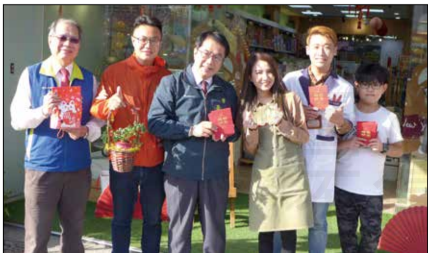
↑臺南市長黃偉哲於大年初三特別到藥局發紅包給藥師，感謝藥師於春節期間仍繼續堅守發放口服抗病毒藥的崗位，讓市民可以安心過年。