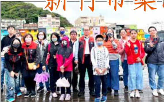
↑新竹市藥師公會於111年12月4日舉辦自強活動一日遊。