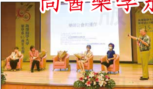
↑高雄醫學大學藥學系於111年10月15日舉辦65週年系慶。