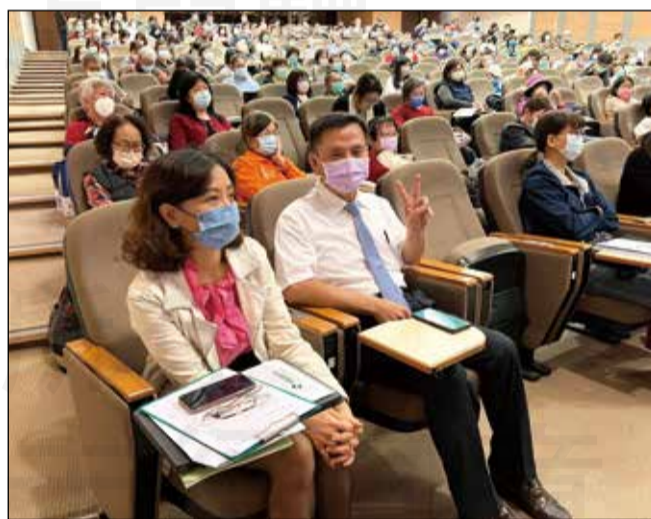
↑高雄市第一藥師公會於3月5日及12日於高雄長庚醫院舉辦繼續教育課程。