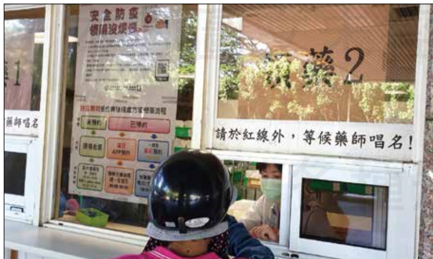
↑ 2020年起，全民進入防疫大作戰，有些醫院設立領慢箋的快速窗口。