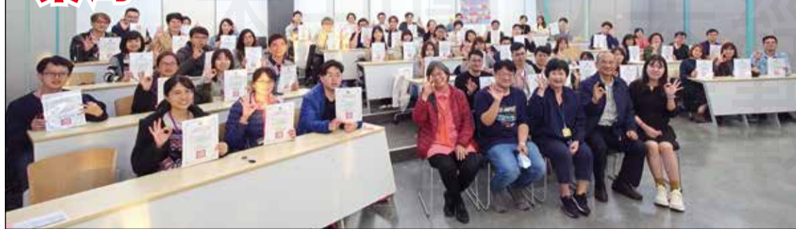
↑111年社區藥局實習指導藥師培訓工作坊，由嘉南藥理大學主辦。