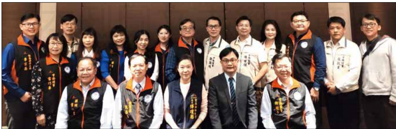
↑臺中市藥師公會與臺中市新藥師公會為凝聚兩會的共識，於3月11日召開聯誼會議。