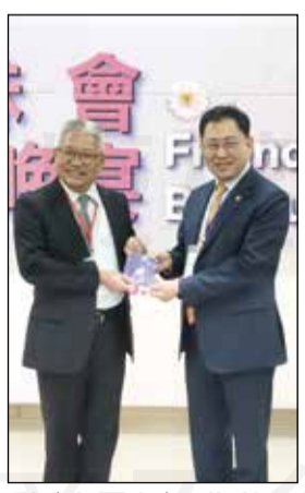
↑藥師公會全聯會理事長黃金舜(右圖左)於3月23日率團拜會大韓藥師會會長崔光勳(右圖右)，期望兩會會務交流熱絡，增進台韓兩國藥事交流。

【本刊訊】藥師公會全聯會理事長黃金舜於3月23日率團赴韓拜會姐妹會，親自拜會大韓藥師