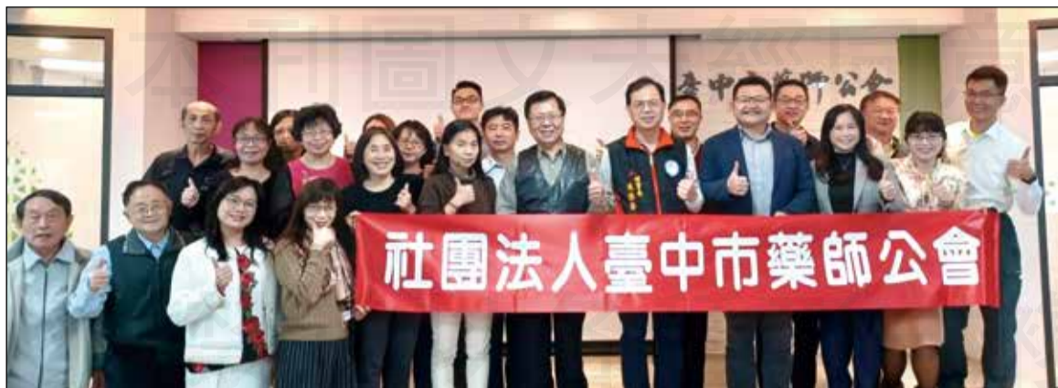
↑臺中市藥師公會舉辦參加FAPA分享會。