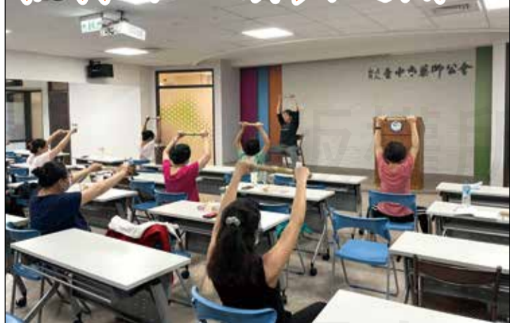
↑臺中市藥師公會樂活藥師志工隊演練「蘭草拍打棒的互動與運用」。