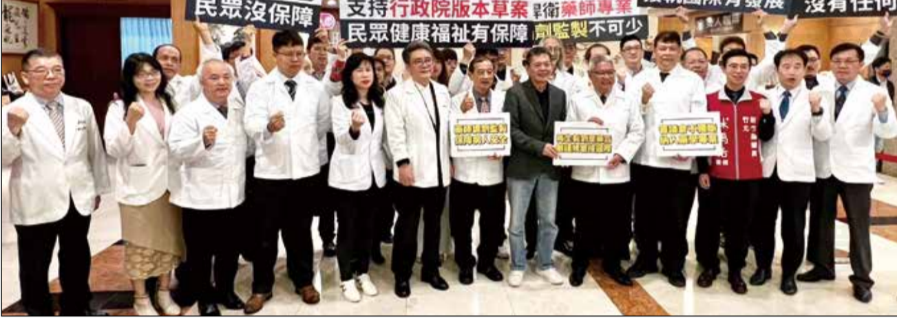
↑藥師公會全聯會於3月28日偕同立委林為洲、陳椒華及台北市、新北市、新竹縣藥師公會、藥劑生公會一同舉辦「再生二法 應落實專業分工嚴謹規管」記者會，對外強調再生二法立法過程中，藥師在其中的重要性，不應被排除。

【本刊訊】立法院衛環委員會近期審查《再生醫療法草案》及《再生醫療製劑條例草案》，藥師公會全聯會於3月28日偕同立委林為洲、陳椒華及台北市、新北市、新竹縣藥師公會、藥劑生公會一同舉辦「再生二法 應落實專業分工嚴謹規管」記者會，對外強