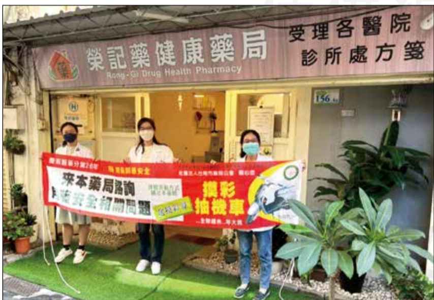
↑藥學生至社區藥局實習，更了解社區藥局的功能。