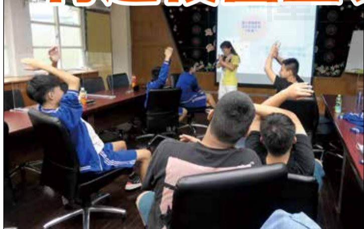
↑藥師至校園用藥安全宣導以遊戲、有獎徵答等方式，讓課程多元有趣。