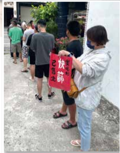
↑社區健保藥局藥師代售政府實名制快篩試劑，得忍受不理智民眾的怪異行為，還怕忘了收錢或收到假鈔而倒貼，這項任務終於在112年4月30日畫下句點。