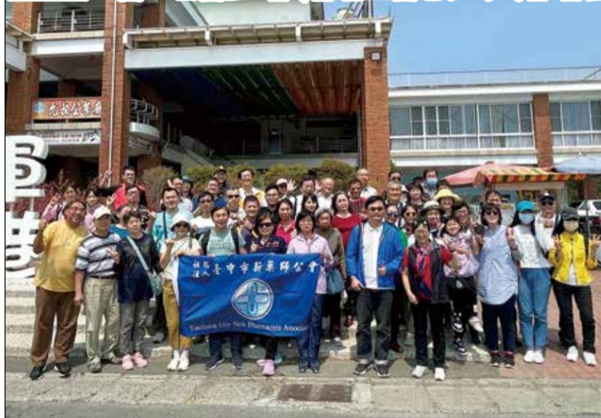
↑臺中市新藥師公會在疫情逐漸緩和之際，於3月19日舉辦自強活動一日遊