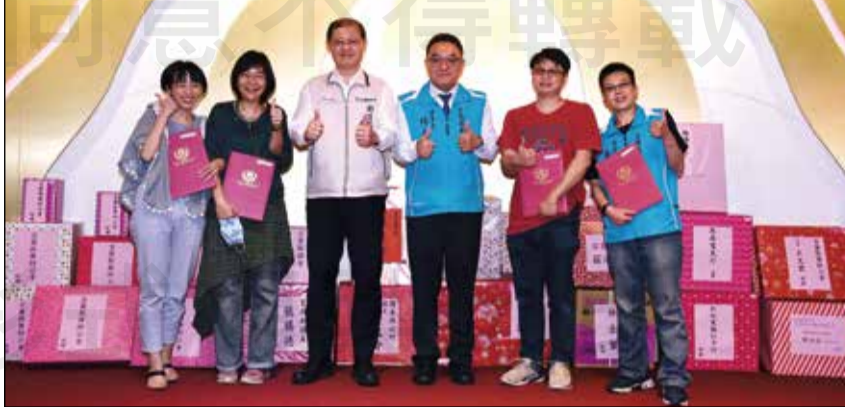
↑ 宜蘭縣藥師公會於4月16日舉行第二十五屆第二次會員大會。