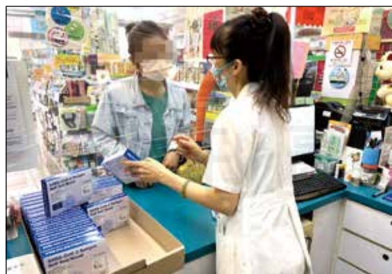
←領取快篩試劑時，藥師細心地跟民眾衛教。

回想起發放快篩試劑那段驚心動魄的日子，至今仍歷歷在目，藥局內外大排長龍，有些民眾甚至會緊張到來核查排隊人數和數量，搞得藥師壓力甚大。也曾發生數位民眾在店內因排隊糾紛而吵了起來，藥師還得出來當和事佬。