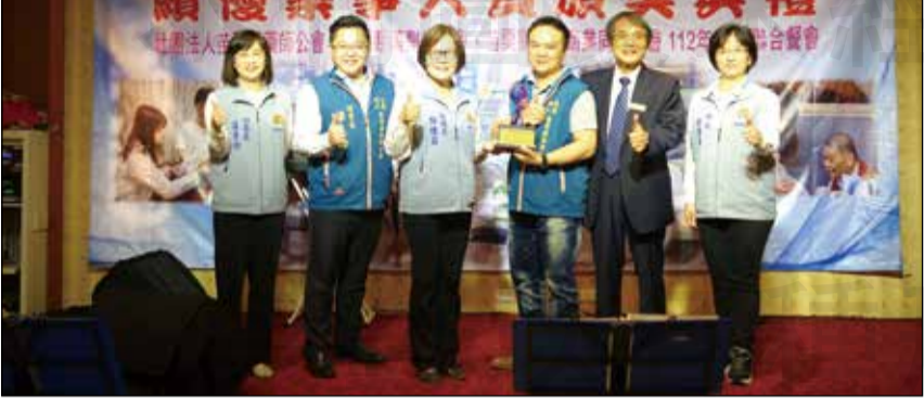
↑ 苗栗縣藥師公會於4月22日召開第二十二屆第二次會員代表大會。