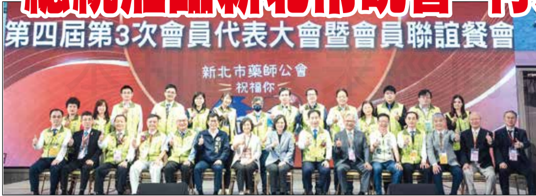
↑新北市藥師公會於4月23日召開第四屆第3次會員代表大會暨會員聯誼餐會，總統蔡英文蒞臨會場並合照。