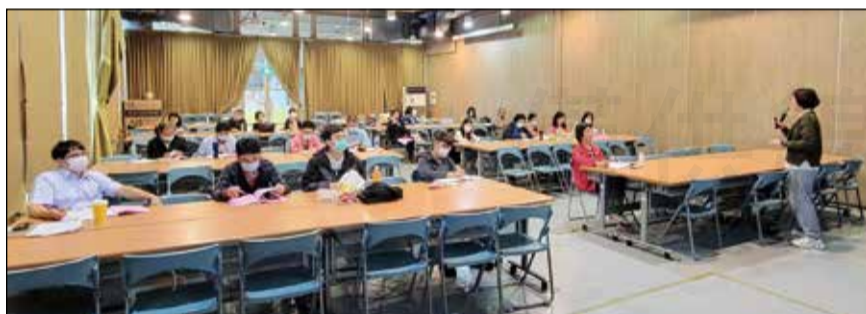
↑ 宜蘭縣藥師公會於4月23日舉辦「完善國內藥事照護及執業品質計畫」培訓課程。