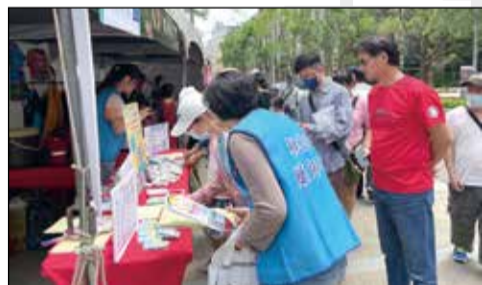
↑桃園市藥師公會於2023龍岡米干節設攤擺位，並推廣「桃園藥知識APP」。