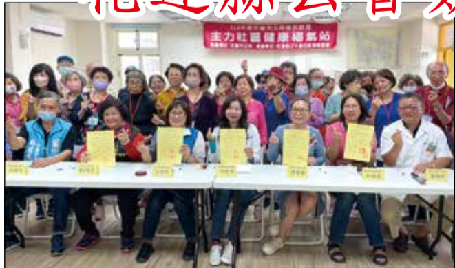
↑ 花蓮縣藥師公會於5月11日與花蓮市四個社區發展協會簽署合作協議。