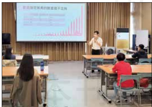
↑宜蘭縣藥師公會於5月21日舉辦「愛滋友善藥局生存之道」與「管制藥品稽核實務及法規宣導」。