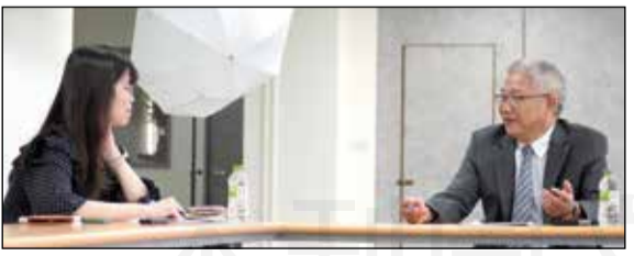
↑商業周刊「大藥局時代」封面故事採訪全聯會理事長黃金舜，探討藥局未來趨勢。