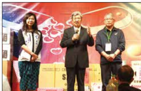
↑花蓮縣藥師公會於5月27日舉辦112年度會員聯誼餐會。行政院長陳建仁(右圖中)親臨會場，感謝藥師於疫情期間的付出。