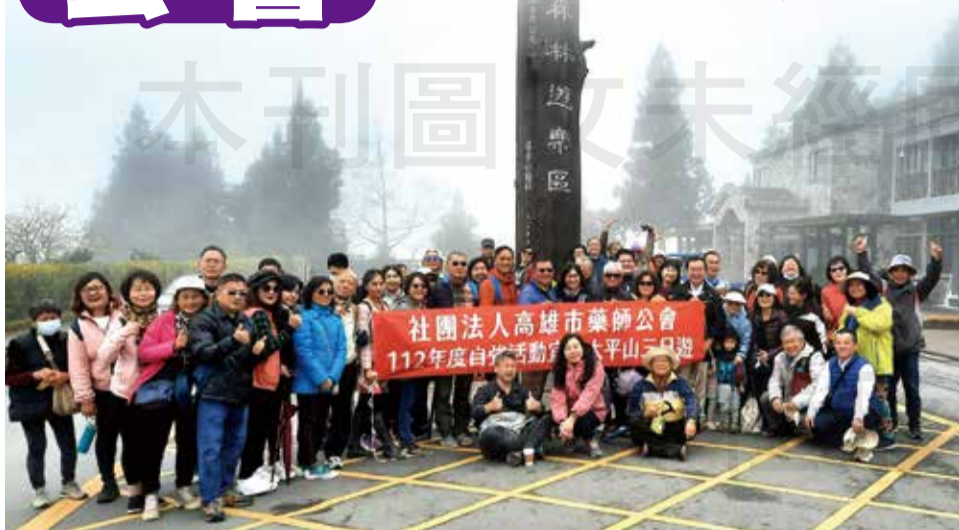
↑ 高雄市藥師公會聯誼委員會舉辦 112 年度自強活動三日遊。