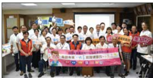
↑嘉義市藥師公會會館於5月19日舉辦含麻黃素製劑流通管理推廣講座。