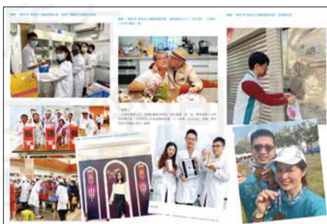
↑「藥來秀」全部作品刊登於「台南藥師分享讚」粉絲頁歡迎全國藥師一起來欣賞台南市藥師的佳文美照。