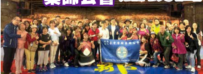
↑ 臺中市新藥師公會於 4 月 9 日舉辦一日遊自強活動。