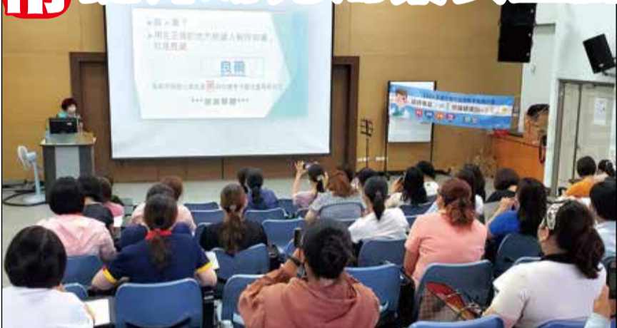
↑由嘉義市政府衛生局主辦、嘉義市藥師公會協辦「提升校園及幼兒園用藥安全認知」課程於6月20日在南興國中舉行。