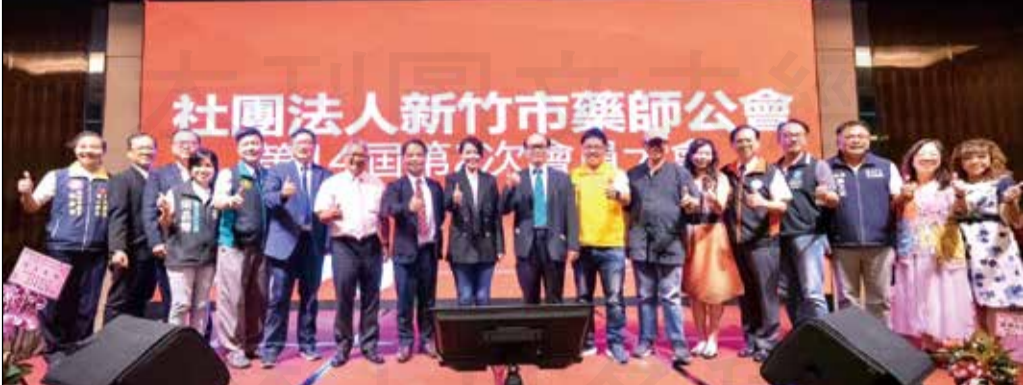
↑新竹市藥師公會第14屆第2次會員大會於6月18日召開，新竹市長高虹安親臨致詞並頒獎。