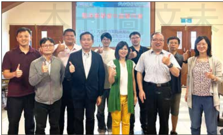
↑苗栗大千醫院舉辦一場知識饗宴，分享教學領域的課程。