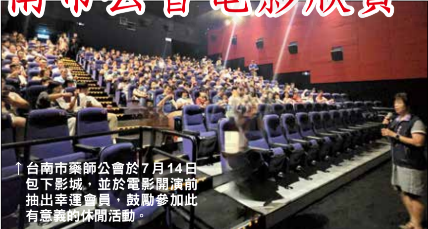
↑台南市藥師公會於7月14日包下影城，並於電影開演前抽出幸運會員，鼓勵參加此有意義的休閒活動。