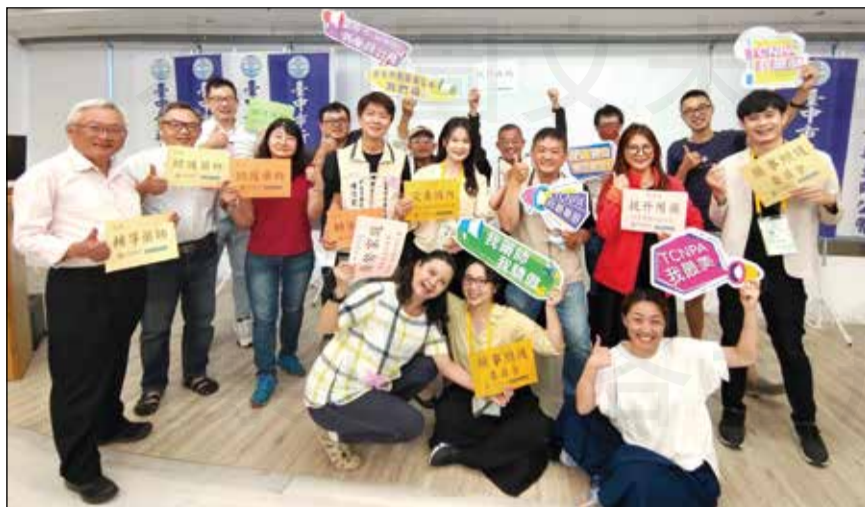
↑臺中市新藥師公會首次針對藥事照護計畫案之輔導藥師開辦培訓課程，採用工作坊的教學型態。