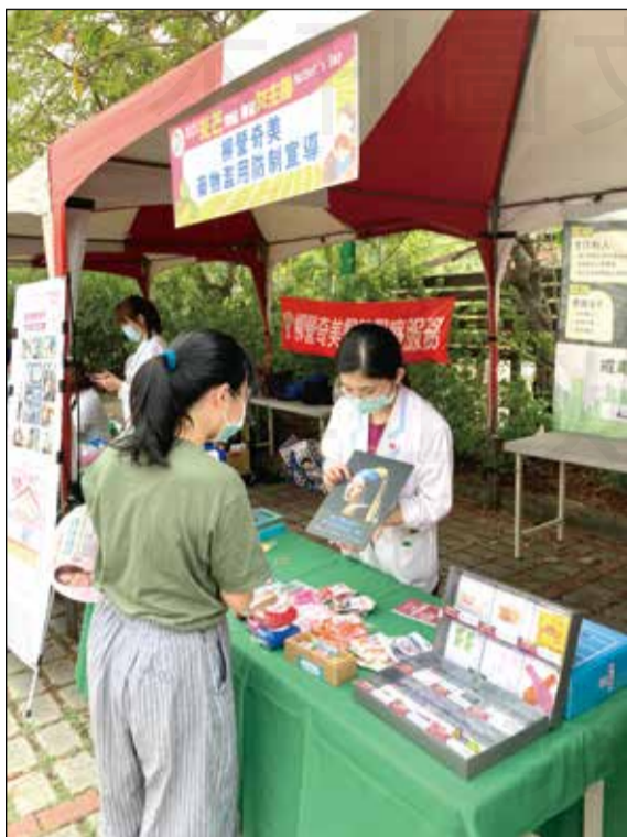
↑台南市柳營區公所主辦「2023光芒閃耀 柳營女主角」，聯合各式體驗活動和健康宣導。