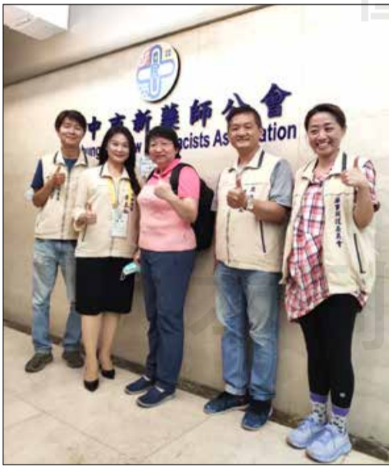
←112年「弱勢家庭暨獨居老人藥事及全人健康照護計畫」輔導月例會由臺中市新藥師公會藥事照護委員會主辦。