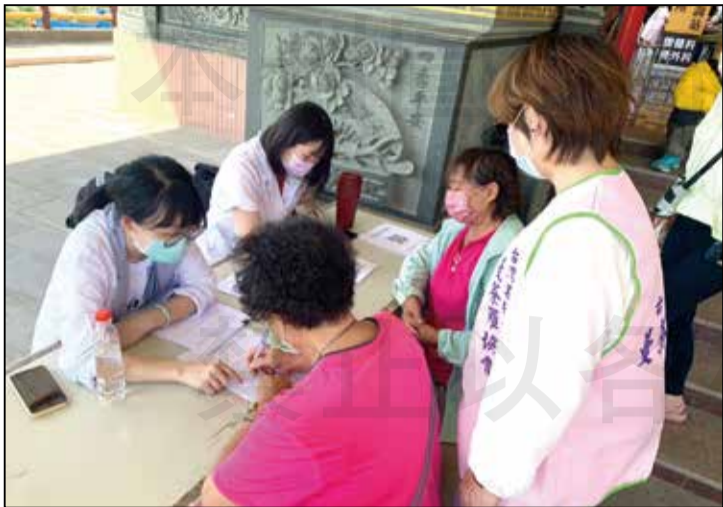
↑高雄長庚醫療團隊結合社區相關服務資源發起「屏東縣琉球鄉健康照護醫起行義診活動」。