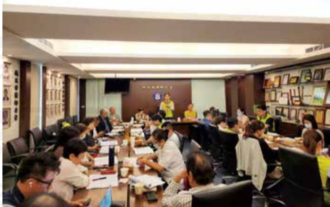
↑最近的苯巴比妥事件議題夯，新北市藥師公會特於6月20日「第四屆第十次理監事聯席會議」時提出討論。