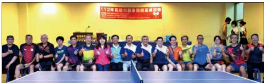
↑高雄市藥師公會與藥劑生公會共同主辦的「112年高雄市醫事團體盃桌球錦標賽」。