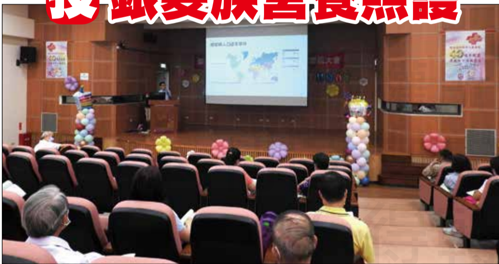
↑南投縣藥師公會於7月8、9及16日，辦理112年藥事人員24點繼續教育課程。