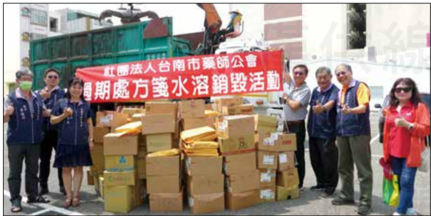
↑台南市藥師公會為避免轄下各健保藥局領藥病患的個資及就醫用藥資料外洩，7月20日大規模舉辦「逾保存年限處方箋『清一清』水溶銷毀活動」。