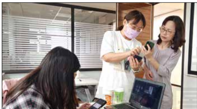
↑ 臺中市藥師公會舉辦「show你的影」短片製作課程。