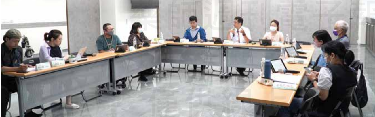
↑藥師公會全聯會於7月26日舉辦「身心障礙族群用藥照護研擬座談會」，藉以完善藥事照護及執業品質。

【本刊訊】台灣多達近8,000家社區藥局，民眾已習以為常的前往領藥以及購買藥品。不過您曾想過嗎？看似簡單的進入藥局購買藥物領藥，對於部分身心障礙的民眾來說，可能是一件不容易的事情。 藥師公會全聯會於7月26日舉辦「身心障礙族群用藥照護研擬座談會」，並邀請食藥署、身心障礙聯盟、智障者家長總會、台灣