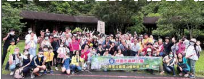
↑桃園市藥師公會112年度自強活動，分三梯次舉行。