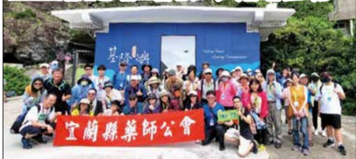
↑宜蘭縣藥師公會舉辦自強活動挑戰基隆嶼攻頂。