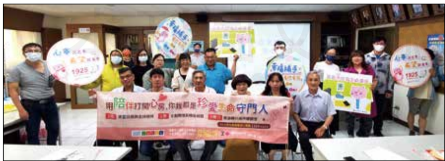
↑嘉義市政府衛生局攜手嘉義市藥師公會，於7月13日舉辦「嘉義市珍愛生命安心藥局計畫」說明及自殺防治宣導課程。