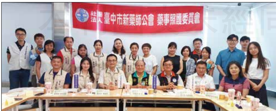
↑臺中市新藥師公會於7月16日舉辦「中部藥師公會藥事照護交流座談會」。